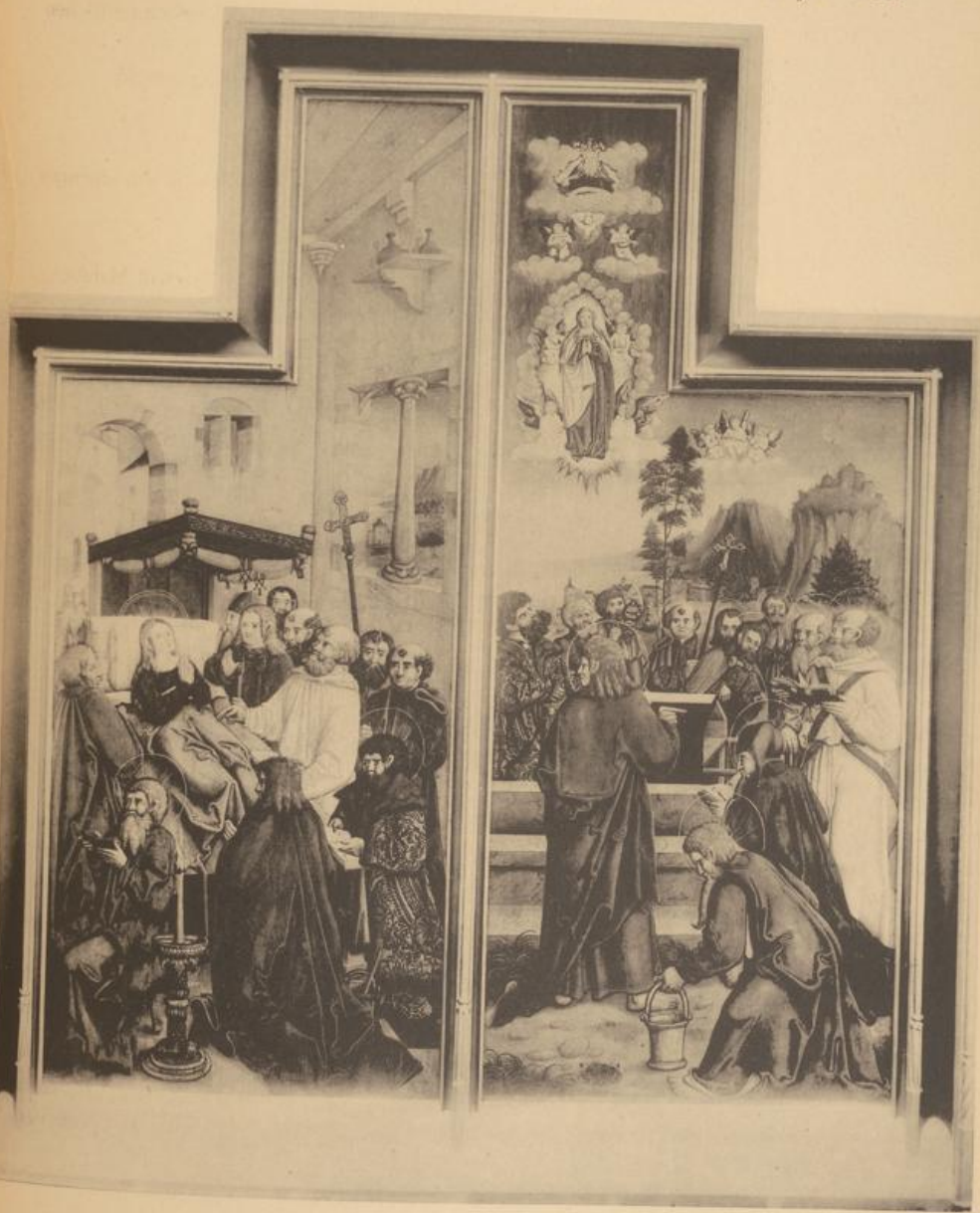
Kippenheim. Pfarrkirche, Tafelgemälde im Langhaus.