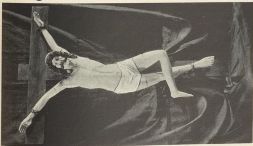
Fig. 221. Oberwöiden. Pfarrkirche. Christus und die beiden Schächer (Holzfiguren).