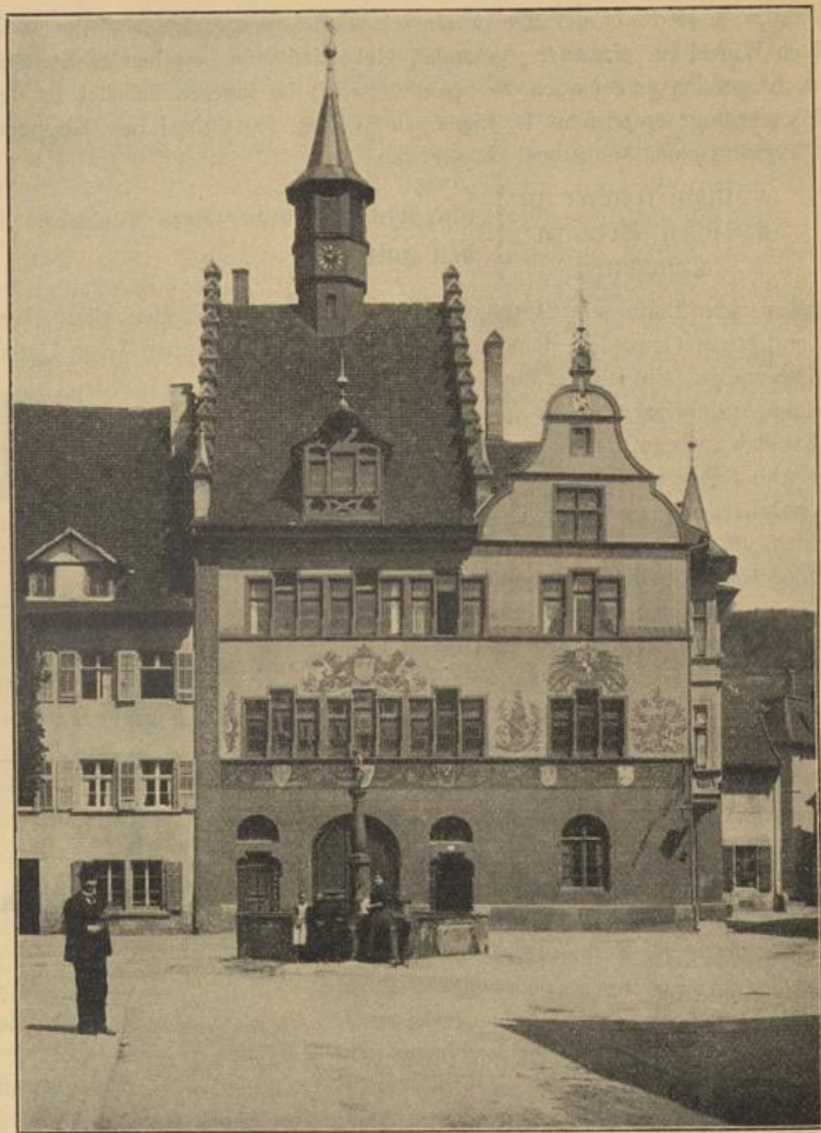
Fig. 203. Staufen. Rathaus.

schrägen Fenstern eine Wendelstiege mit gewundener Spindel zu den oberen Geschossen.