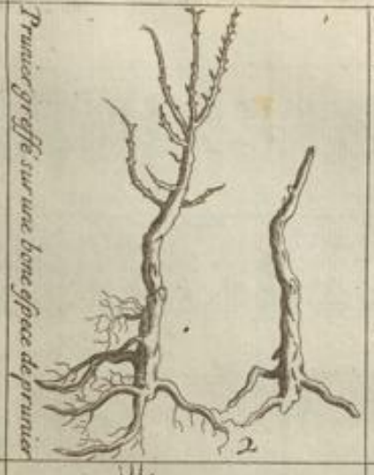
Prunier greffe sur une brme espece de prunier