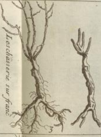
Leschasterie sur fram