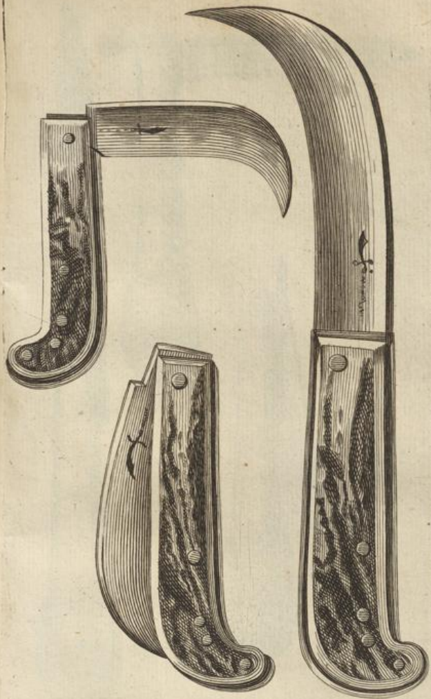
Pag. 22. tom. 2.