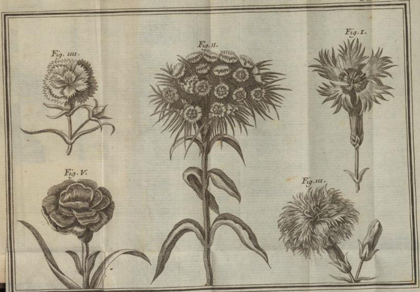
J. Avchne Sculp.