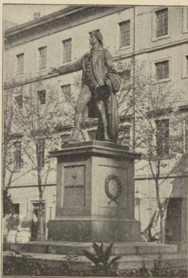
Das Schiller-Denkmal in Mannheim.*)

Robert triumphierte. Sein Nebenbuhler war aus dem Felde geschlagen, und Hannchens Gunst für den Bettler verloren. Wolf kannte seinen Feind, und dieser Feind war der glückliche Besitzer seiner Johanne. Drückendes Gefühl des Mangels gesellte sich zu beleidigtem Stolge. Not und Eifersucht stürmen vereinigt auf seine Empfindlichkeit ein, der Hunger treibt ihn hinaus in die weite Welt, Rache und Leidenschaft halten ihn fest. Er wird zum zweiten Mal Wilddieb; aber Ro-