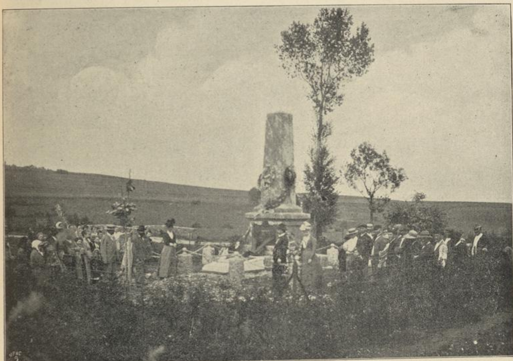
Deutsch-französisches Krieger-Denkmal bei Chenebier, 15. bis 17. Januar 1871.

thun sollte. Eine unsichtbare, fürchterliche Hand schwebte über mir, der Stundenweiser meines Schicksals zeigte unwiderruflich auf diese schwarze Minute. Der Arm zitterte mir, da ich meiner Flinte die schreckliche Wahl erlaubte — meine Zähne schlugen zusammen wie im Fieberfrost, und der Odem sperrte sich erstickend in meiner Lunge. Eine Minute lang blieb der Lauf meiner Flinte ungewiß zwischen dem Menschen und dem Hirsch mitten