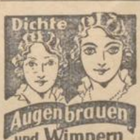
Dichte Augenbrauen und Wimpern

Glanz u. Ausdruck des Blickes wird erhöht durch Haphex-Augenfeuer. Erfrischt und belebt infolge seiner balsamischen Eigenschaften die Augen in wohlthuender Weise, macht sie strahlender und glanzvoller, beseitigt die Schatten u. dunklen Ränder unter den Augenlidern, verwischt die Spuren durchwachter Nächte. Vorzüglich auch gegen schwache, rote, entzündete und tränende Augen. Flasche mit Glasstab M. 3.20