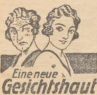
Eine neue Gesichtshaut

Unsere Haphex-Hautschäl-Kur schält die obere, fleckige, runzelige Hautschicht ganz zart und unmerklich ab und darunter erseht eine neue, rosensfarbige, reine Haut von der Zartheit eines Kindes. Völlig unschädlich! (Nicht reizend), Radikalmittel gegen alle Hautfehler, Hautverfärbungen, Flecken, Pusteln, Pickel, Mitesser, Sommersprossen, Ausschläge, Röte usw. Preis Mk. 7.50