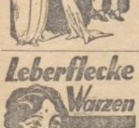
Leberflecke Warzen Muttermale

und schön gewellte Haare machen jedes Gesicht freundlich und anziehend! Unser Haphex-Lockenwasser erzeugt ohne Brennschere naturgetreue Locken und Haarwellen von langer Haltbarkeit, selbst b. Schwweiß u. feuchter Witterung. Fl. Mk. 3.20, mit Wellenmadeln 4.20 Mk.