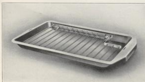
Bratschüssel mit Rosteinlage