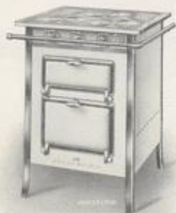
Nr. 451 mit 3 Doppelsparbrennern, ohne Abstellplatten