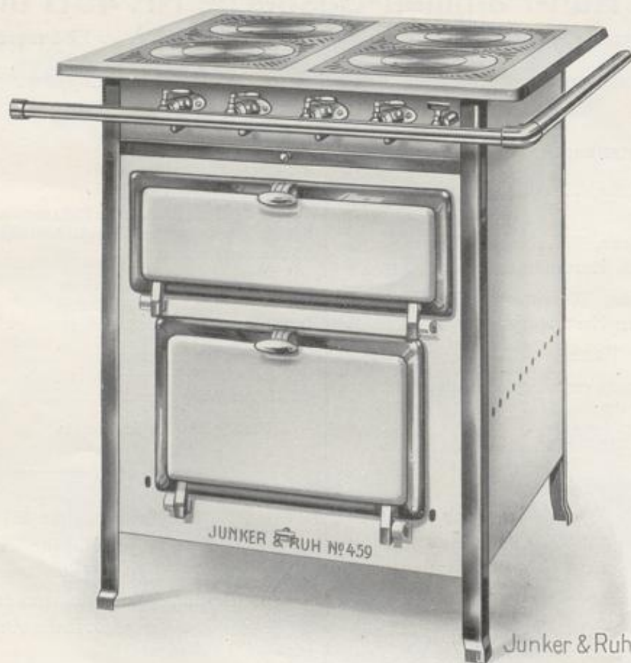
Nr. 459 mit 4 Doppelsparbrennern

mit besonders großem Brat- und Backofen und Wärmeschrank