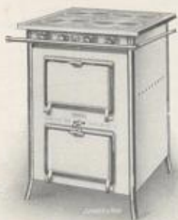
Nr. 3620 mit 4 Doppel- sparbrennern, ohne Abstellplatten