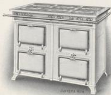
Nr. 195 mit 6 Doppelsparbrennern, ohne Abstellplatten

Abstellplatten werden nur auf Bestellung geliefert in Ausstattung schwarz, poliert und emailliert