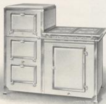
Nr. 854 mit 4 Doppelsparbrennern, ohne Abstellplatte