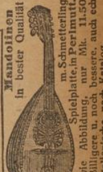
Mandolinen in bester Qualität

Herfeld & Compagnie in Neuenrade Nr. 182 Westf. Tatsächlich größte u. leistungsfähigste Musikinstrumenten-Firma in Neuenrade