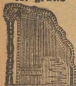
5 Akk., 77 Sait., Mk. 14.—, 6 Akk., 92 Sait., Mk. 16.—