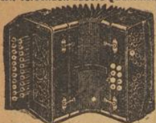
Wiener Harmonikas dauerhafte Ausführung i. Bau und Stimmen

Wir versenden unsere Qualitätsinstrumente zu nachfolgenden, außerordentlich gewöhnlich billigen Preisen gegen Nachnahme