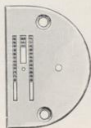
Stichplatte mit Transporteur der R-Maschine

Rundschiffmaschinen können auch mit Kniehebellüfter versehen werden. Für gewerbliche Zwecke ist der Kniehebellüfter von großem Vorteil. Der Mehrpreis hierfür beträgt M 8