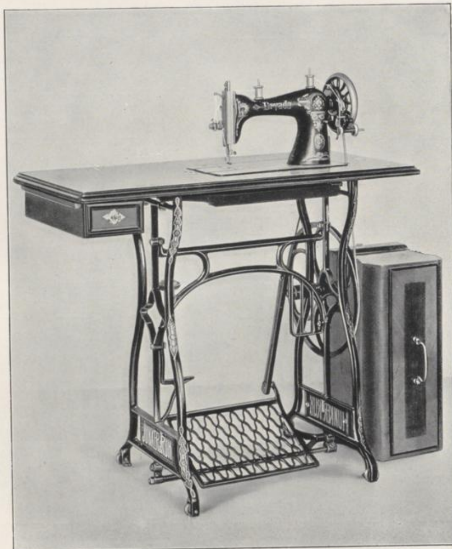
TRETMASCHINE AUF KUGELLAGERGESELL R kann auf Wunsch auch auf dem modernen Gestell M geliefert werden

Für Familiengebrauch und leichte Gewerbe