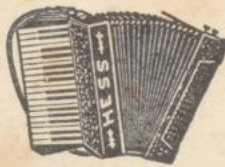
Nr. 82 wie Bild 91 mit 30 Tast., 24 verkopp. Bässe, eine große Harmonika zu kleinem Preis. 2schöbrig M 65.- Nr. 82 in 8schöbrig, mit Register . . . . . M 62.- Nr. 80 mit 34 Tasten, 48 Bässen, verkopp. . . . . M 81.- Nr. 91 mit 34 Tast., 80 Bässe, 6fach verk., 2schöbrig M 88.-