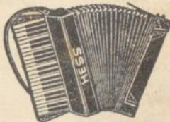
Nr. 82 mit 41 Tast., 120 Bässe, 6fach verk. M 120.- Nr. 92 in 8schöbrig, mit Register . . . . . M 149.- in Luxusausstattg. M 168.-

Sämtliche Hess-Harmonikas (auch die billigsten Sorten) werden nur noch mit Stimmen nach dem DRP.-Rundschliff-Verfahren mit Handarbeit geliefert. Rundschliffstimmen sind im Klang und in der Dauerhaftigkeit kaum zu übertreffen!