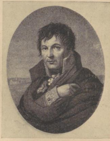
Frage 9: Preußischer General, Erneuerer der Wehrmacht (1813). Wer?

D der nat der fehl Ber men E S Fre wer deu ver Ma dru E stat ab. Ma "S "S der "S Ziv "S D und Sie ter ein deit Fri Her die lich D "U Ha "S E Ich D hief