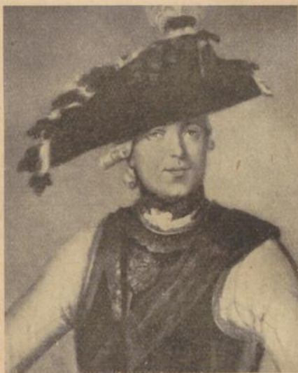
Frage 4: Preussischer Feldherr unter Friedrich dem Großen. Wer?