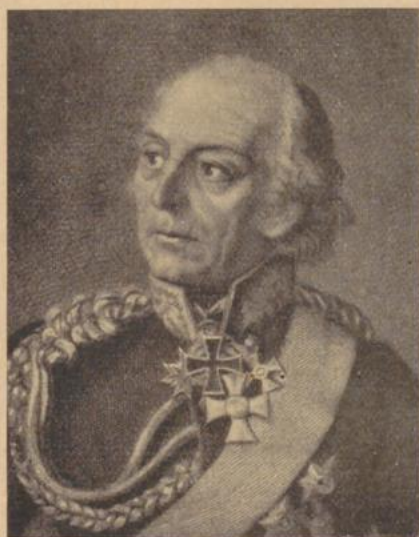
Frage 5: Der Schöpfer der Konvention von Tau- roggen. Wer?