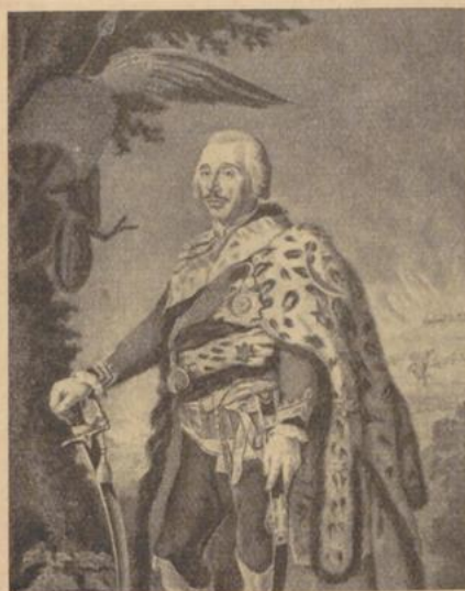
Frage 3: Preussischer Reitergeneral unter Friedrich dem Großen. Wer?