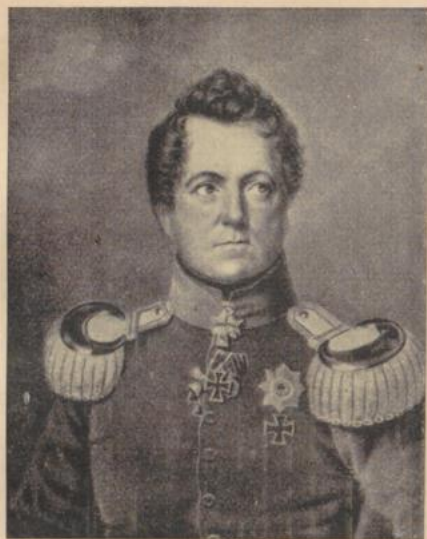
Frage 7: Preußischer Generalfeldmarschall (1813/14). Wer?