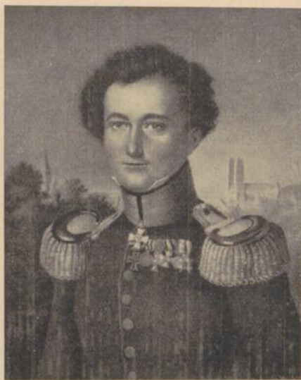
Frage 8: Verfasser des berühmtesten der deutschen Werke „Vom Kriege“. Wer?