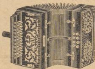
Feine Wiener Harmonikas