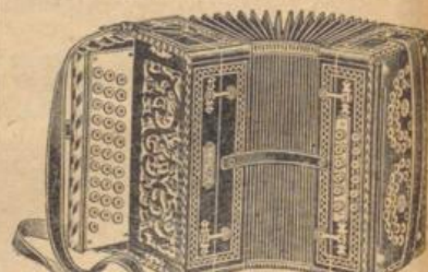
Bozner-Modelle in überaus solid. preiswerter Ausführung, m. auf Leder liegenden Platten extra soliden Bälgen