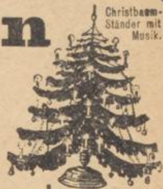
Christbaum-Ständer mit Musik.

Man erhält umsonst und portofrei unseren Katalog mit über 4000 Abbildungen von Taschenu. Wanduhren, Weckern, Ketten, Schmucksachen aller Art, photographischen Apparaten, Prismen- und Theatergläsern, Geschenk-Artikeln für den praktischen Gebrauch und Luxus, Sprechmaschinen u. Musikinstrumenten.