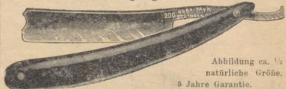
Abbildung ca. 1/2 natürliche Größe.

für jeden Bart passend, aus prima englischem Silberstahl geschmiedet, fein hohlgeschliffen, scharf und gebrauchsfertig abgezogen.