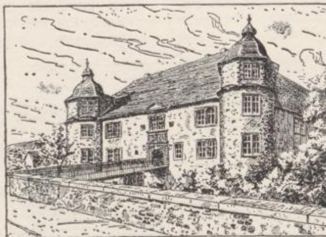
Oberes Schloß, jetzt Bürgermeisteramt und Oeffentliche Sparkasse mit Alpengarten

Und wenn erst in schöner Maienzeit all die Fliederbäume ihre Blüten erschliessen, dann vermag der Wanderer und Erholungsuchende sich kaum zu trennen von dem zauberhaften Bilde, das ihm lange Zeit noch Erleben sein wird.