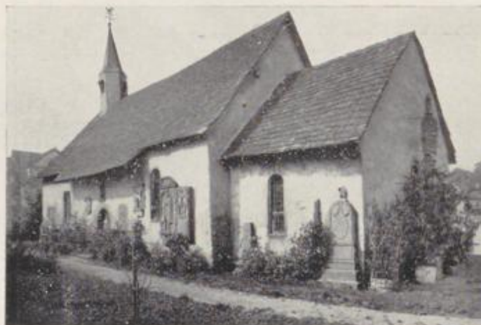
Alt St. Peter (Museum)

seinen Kinderjahren hinaufreicht ins 13. Jahrhundert, und der vertraut hineingrößt in die alten Gassen und Gäßchen, in denen er so viel Geschlechter kommen und gehen sah.