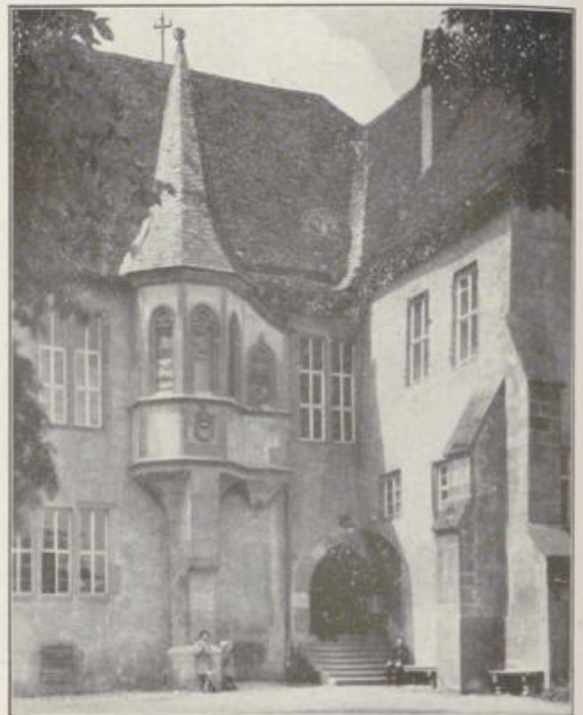
Das Kurmainzer Schloß (Eingang)

Gewaltig in seinen Maßen ragt das kurmainzische Schloß mit seinen runden Ecktürmen, mit hohem Wohngebäude und Erker, mit Fachwerk und Giebeln auf. Die gediegene Pracht der würdigen Diele läßt vermuten, daß hier manch frohes Fest mit altem Tauberwein beim Schein der Kerzen gewürzt wurde, und über allem steht wie ein grauer Recke der Vorzeit der gewaltige Türmersturm, das Wahrzeichen der Stadt, der mit