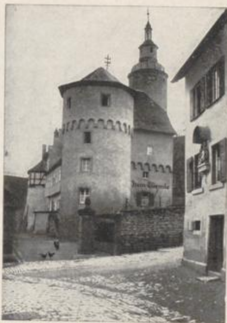
Türme mit Türmersturm

Alte Stadtmauerreste träumen heute noch von dem einstigen stolzen Bild der ummauerten Stadt mit ihren 20 Türmen. Die Zeilen der Bürgerhäuser lösen sich bei näherem Hinsehen in eine Vielheit von Bauformen auf: alte Patrizierhäuser und hohe Fachwerkbauten, breite fränkische Hofeinfahrten und schmale Häuschen mit lauschigen Winkeln. Aber ob sie Wohlstand oder Beschränkung kün-