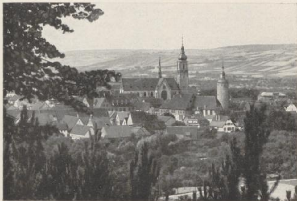
Gesamtbild von Tauberbischofsheim

Im anmutigen Taubertal, an der Bahn zwischen Bad Mergentheim und Wertheim, an den Fernverkehrsstraßen 27 und 363 liegt die Metropole des Bad. Frankenlandes, das alte Amtsstädtchen Tauberbischofsheim , mit seiner reichen Geschichte aus der Vergangenheit und seinem Ruf als hervorragende Schulstadt der Gegenwart.