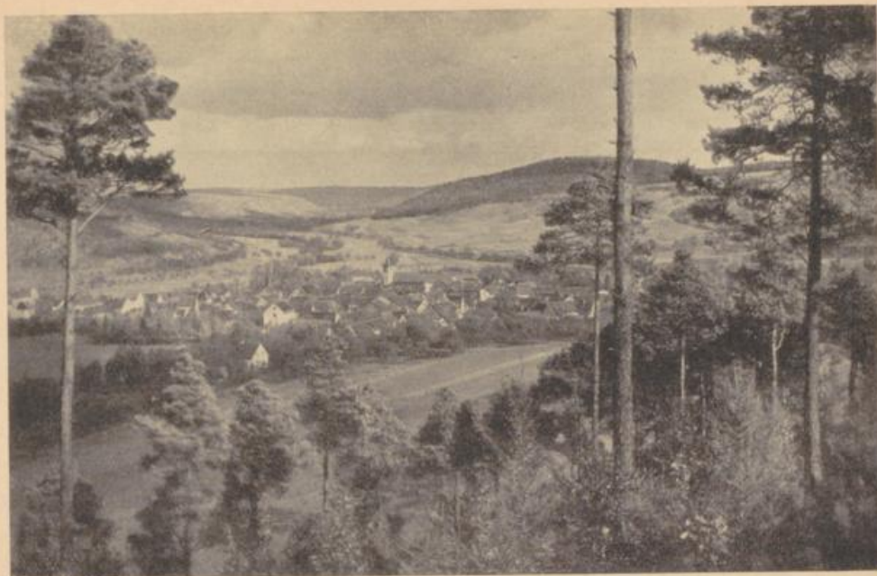
Grüß dich Gott, mein Frankenland!