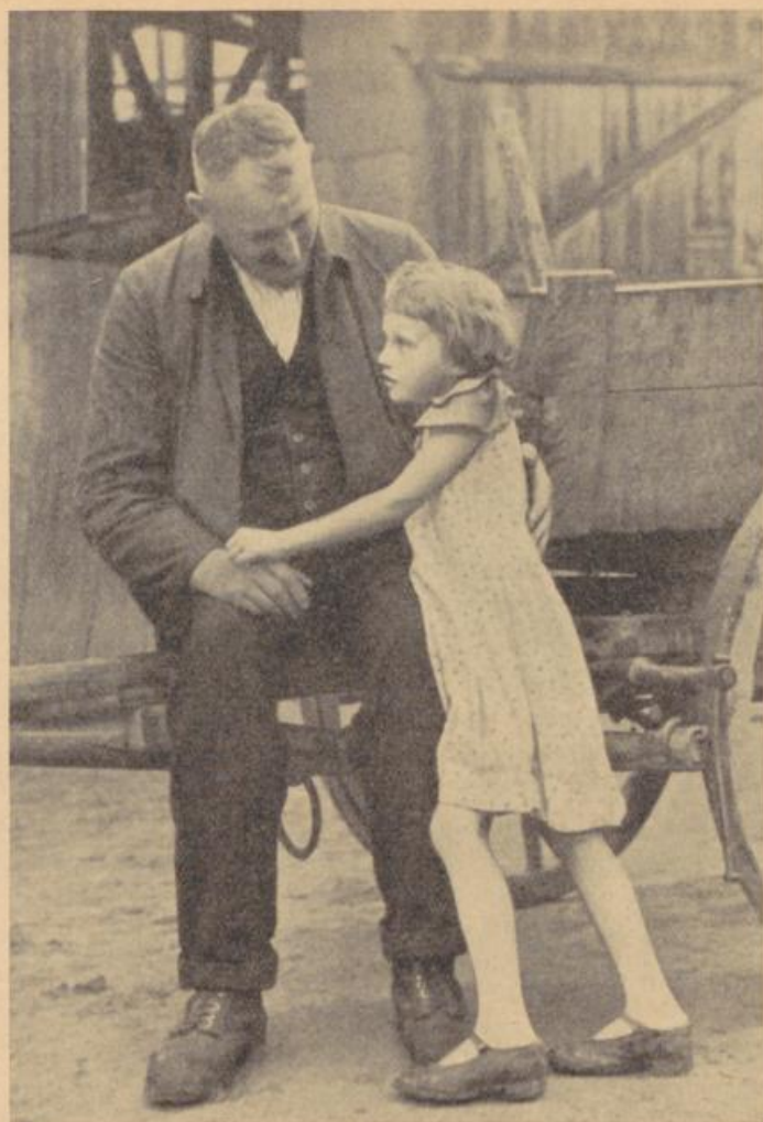
Beweise auch Du Deine Einstellung zur Volksgemeinschaft! Nimm ein Ferienkind aus der Stadt durch die NSB

Als mich die Rosine beim Fortgehen hinausbegleitete, fragte ich sie unter der Haustüre, ob ich vielleicht auch einmal ohne eine Ausrede nach der Oberegg hinaufkommen dürfte? Das könne ich halten, wie ich's für gut finde, gab sie mir etwas verlegen zum Bescheid. Ich war nicht im Zweifel darüber, wie das gemeint war; es hieß etwa gleichviel, wie wenn sie gesagt hätte: „Du bist mir zu jeder Stunde willkommen.“