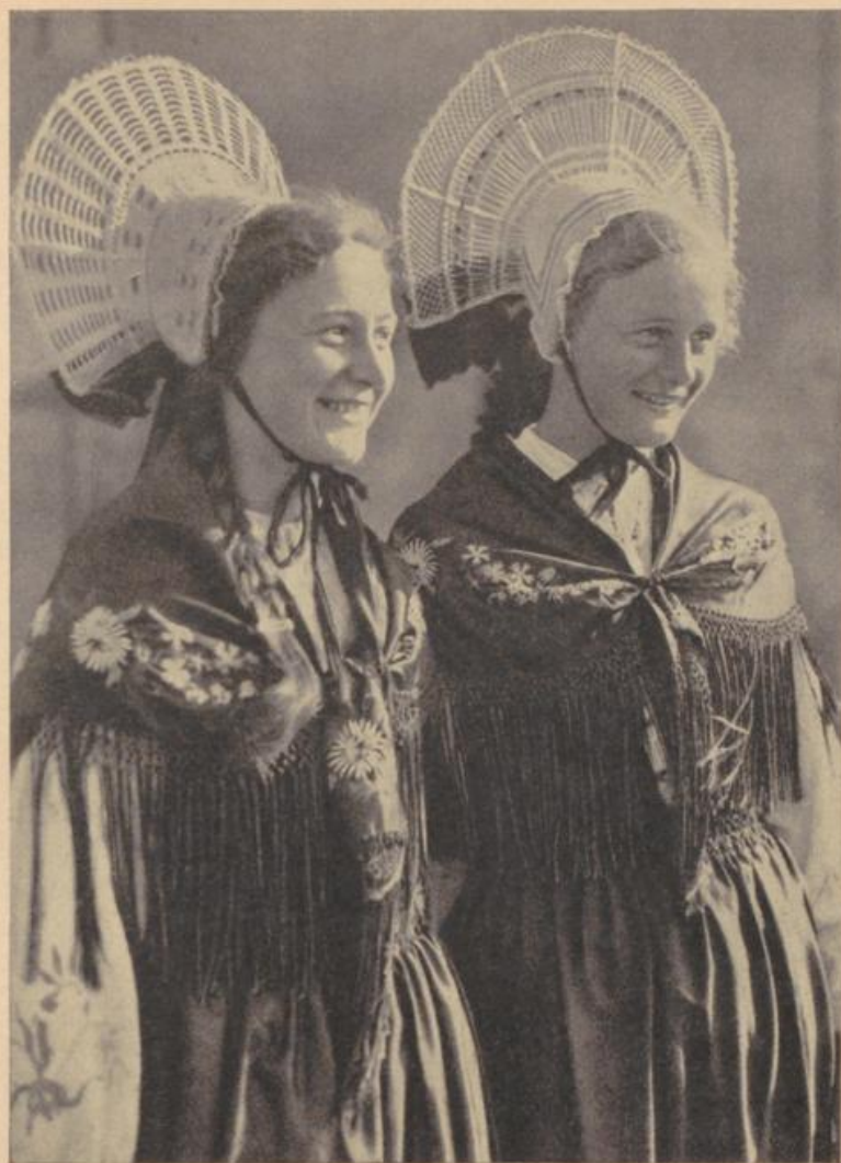
Hegauer Bauernmädchen in der wiedererstandenen Tracht ihrer Heimat

Fast wie im Traume ging ich von ihr weg. Wie ich langsam am Fenster vorbeischnitt, hörte ich drinnen leise an die Scheiben klopfen. Ich stand still. Sie hatte schon den einen Flügel offen und lachte mich an aus ihren hellen Sonntagsaugen. „Noch einen Kuß! Hier durchs Fenster!“ flüsterte sie. „Den allerallerlehten, gelt?“