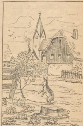
Wo ist der Kohlgärtner?

Große G Durch werden er Ansetzung getragen. unkundigen haft in den Beranlassen Geher u. C empfehlen. vielen Jahr Unter Garo Reinigung zu den denf ale besinde Betten, Sei Kalksteinen Preiswürdig kostenfrei kostenfrei gelegenheit ge trages von Geschäfts zu ponce im W Eine Mil werden alljä fertigt. We dontons, Bi direkt vom zu empfehlen Herold in Firma ist i Aufforderung schreiben, w äußerst viel dranchbare versäume d neuen Katal Die Fi Straße 7 in verzeichnisse Reichhaltigk und Anleim Holzbrand, über 1500 Gegenstände allen Dilet jengen. (Geg obrig