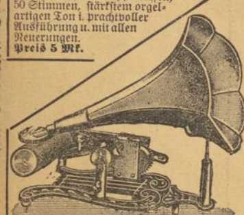
Nr. 2. Phono-graph mit garantiert lautem, deutlichem Ton u. großer Klangfülle, mit Blumen- od. glattem Nadeltrichter. Preis 5 Mk. Beste Gartenzugharmonika pro St. 1 Mk.