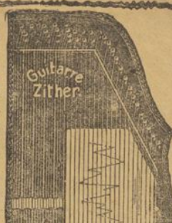
Nr. 3. Gitarre-Zither, 50 cm lang, mit 5 Akkorden u. 41 Saiten, m. Saule, Schüssel, Ring u. Stimmstange u. herrlicher Tonfülle, nach unter die Saiten zu schiebenden Notenblätter sofort auszuspielen. Preis 8 Mk. 25 Notenblätter im Werte von 2 1/2 Mk. gratis.

Mit 2. zweier und besser Glockenbegleitung kosten dieselben 30 Pfg., mit bester, bewährtester Tremolando-Einrichtung 50 Pfg. oder mit Zymbalgeläute 60 Pfg. mehr. Gitarre-Zithern mit 6 Akkorden und 49 Saiten kosten mit allem Zubehör und 25 Notenblättern im Werte von 2 1/2 Mk. nur 9 1/2 Mk. Kleinere Zithern ebenfalls billiger. Wir legen außerdem auch diesen Zithern und Harmonikas ein Sortiment von 50 St. Künstler-Ansichtskarten im Detail-Verkaufs-wert von 5 Mk. als Prämie gratis bei. Dagegen liefern wir kleinere und deshalb billigere Harmonikas auf Wunsch ebenfalls in 2 chörig zu 4 Mk., in 3 chörig zu 5 Mk., in 4 chörig zu 6 1/2 Mk. und in 2-reihig mit 21 Tasten, 4 Bässen schon zu 7 1/2 Mk.