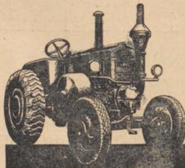
In eigener Werkstätte stehen Ersatzteile für obige Fabrikate zur Verfügung.