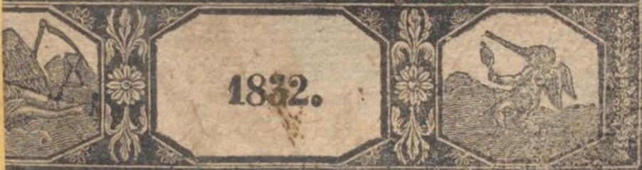
Der große Straßburger hinfende Bote.