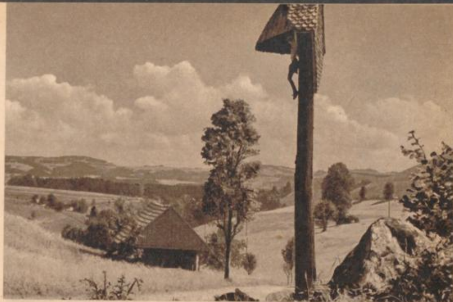
Wegkreuz auf den Höhen des Schwarzwaldes (St. Peter)

Vor St. Johannistag keine Gerste man loben mag.