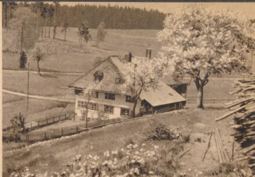
Frühlingslandschaft bei Friedenweiler

Der April ist nicht zu gut, er schneit dem Bauersmann auf den Hut.