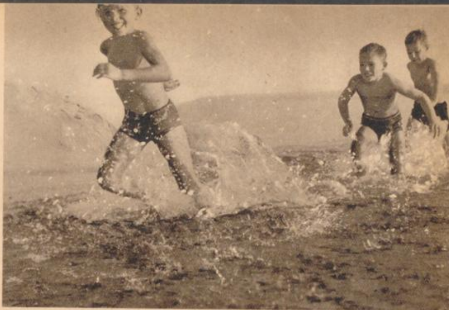
Freuden des Sommers

Hat unsre Frau gut Wetter, wenn sie zum Himmel fährt, gewiß sie guten Wein beschert.