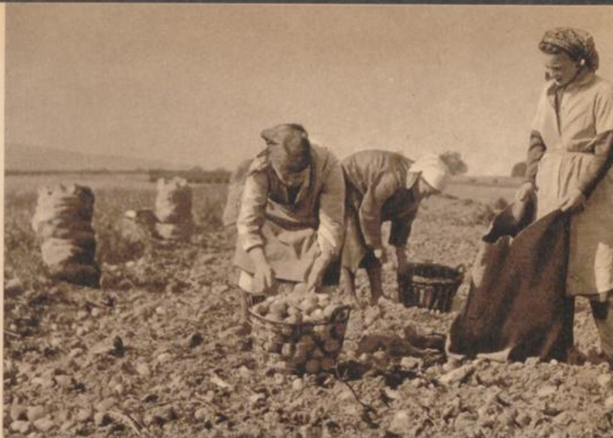
Segen des Herbstes