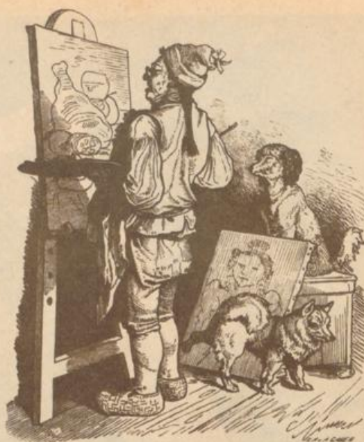
Meister, Kenner und Kritikus

Die Stiefeln wär'n aber nich halten! Was, Herr! — Die nich halten? Die Stiefeln können Se vom höchsten Kirchturm fallen lassen, se gehn nich entzwee.