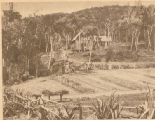
Ein Bild aus der kath. Gemeinschaftsiedlung „Heimat“ in Brasilien (Erster Umbruch der Rodung)

Wünsche, daß doch in all dem Wandel und den Wirren unserer Zeit Gottes Finger seinen Gläubigen immer wieder sichtbar werde. So werden sie nicht verzagen, auch wenn es schwere und finstere Tage gibt, wie es diese sind, in denen diese Zeilen in die Presse gehen, wo feige Mörder voll Haß und Eigensucht den treu-katholischen Bundeskanzler Dollfuß niederschossen und damit das arme gequälte Bruderland Österreich in neue Unruhe und Schwierigkeiten stürzten. Wir wollen überall und immer Vertrauen haben auf das Wort unseres Gottes, daß das Reich Christi ein ewiges Reich ist und seine Macht ewige Macht und keine Gewalt der Erde ihm gegen den Willen Christi des Königs etwas wird anhaben können. „Non praevalent, die höllischen Mächte werden es nicht überwältigen.“ (Matth. 16, 18.)