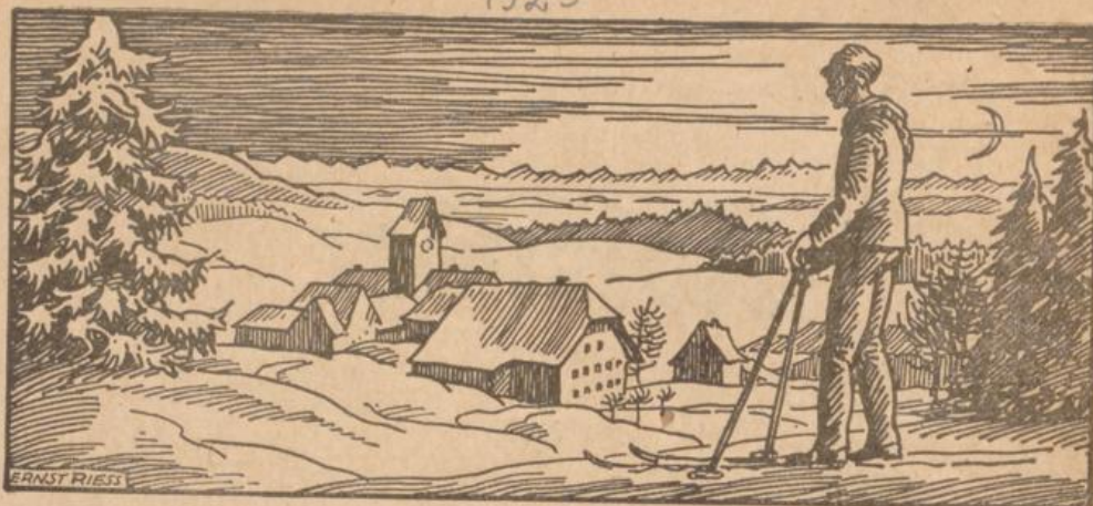
Der Winter hat sein starres Dehnen Um alle Furchen ausgespannt.