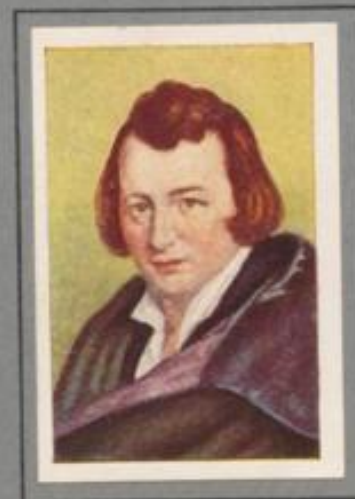
6. Heinrich Heine

geb. 1787 in Tübingen, gest. 1862 ebendasselbst. Bedeutender Literaturhistoriker und Sagenforscher. Von seinen Gedichten sind die Balladen volkstümlich geworden.