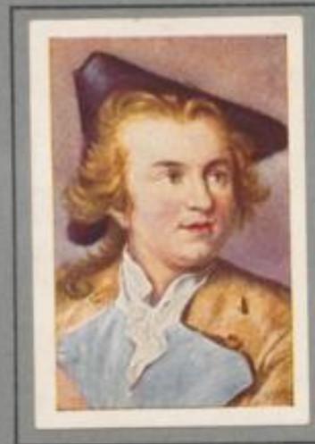
3. Gotthold Ephraim Lessing

geb. 1759 in Marbach, gest. 1805 zu Weimar. Sein erstes Drama „Die Räuber“ vollendete er 18-jährig. Unter dem Einfluß seiner Tätigkeit als Geschichtsprofessor sind seine historischen Werke wie „Wallenstein“ und „Don Carlos“ entstanden.