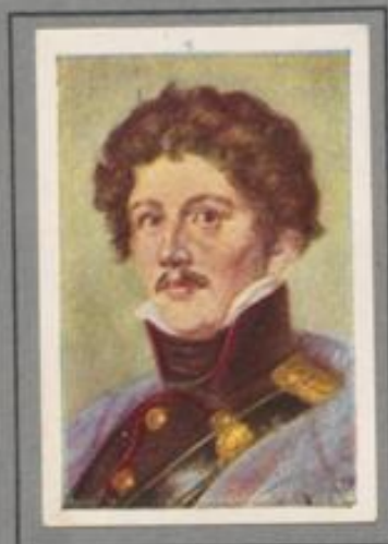
4. Karl Theodor Körner

geb. 1729 in Sachsen, gest. 1781 in Braunschweig. Meister des Prosastils, berühmt durch seine Schöpfungen „Minna von Barnhelm“, „Nathan der Weise“ und bedeutend zugleich als Philosoph.