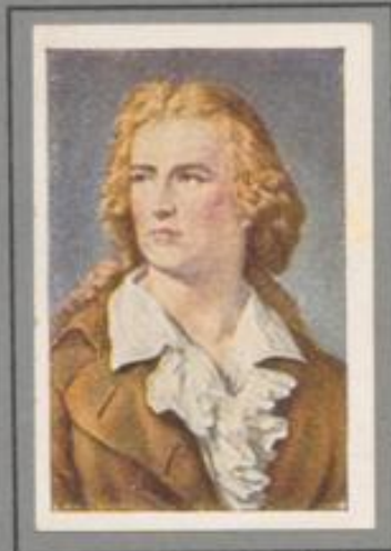
2. Friedrich v. Schiller

geb. 1749 in Frankfurt a. M., gest. 1832 in Weimar. Einer der universellsten Geister, nicht nur als Dichter, sondern auch als Ästhetiker, Altertumsforscher, Naturforscher und Staatsmann bedeutend.