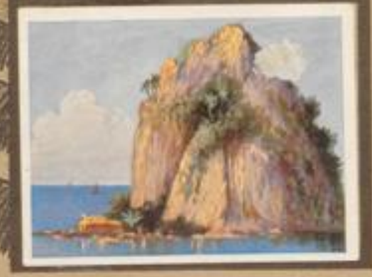
209 „Steininsel“ in der Bismarcksee. Die Felsen, aus vulkanischen Gestein (Zuff) bestehend, sind erbebenhaft und vom tiefblauen Wasser der Bucht.