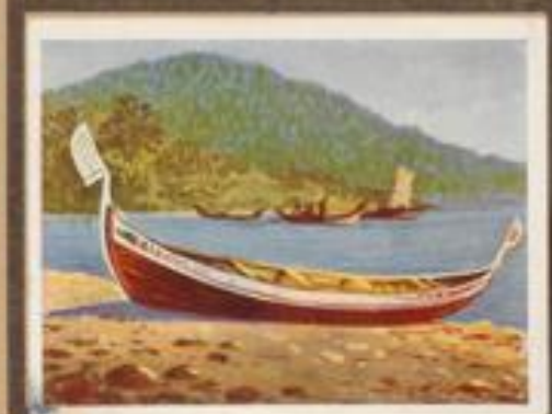
217 Eingeborenenboot in der Bucht von Milneba (Neuguinea, Bismarckküste). Das gegenüber dem Auslegerbaum geräumigen Plankensboot ist von den Australiern her eingeführt worden.