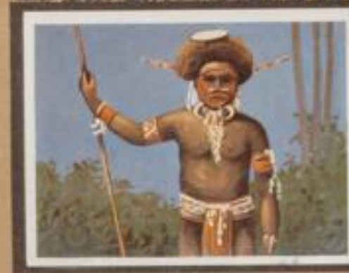
211 Brianefer von Neupommern. Die Brianefer wohnen in festen Stützpfeilern und haben eine starke Organisation, deren Grundzüge die Bau- und Verfassungsgemeinschaft bilden.