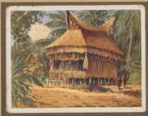
213 Heilige Hütte auf Motup (Neuguinea). Kriem- und Siamonverehrung sowie Zauber und Magischer beherrschen die Eingeborenen.