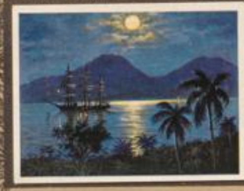
212 Vollmond Nacht und Tochter auf der Hauptinsel. Die 600 m hohe Vulkangruppe bildet ein riesiges und ist auf der Höhe mit Schneeflecken bedeckt.