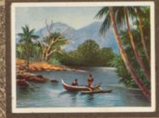
210 Buchtlandschaft von der Hauptinsel (Neupommern). Das Innere der Hauptinsel wird von den bis 1300 m aufragenden, dichtbewaldeten Gebirgsbergen eingenommen, von denen der Hauptstrom der Regen, der Kolumbustag, sein reichliches Wasser erhält.