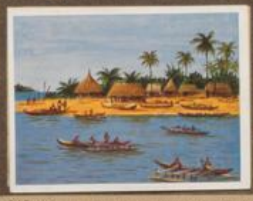
216 Hafen von Motup, einer kleinen, bevölkerten Insel in der Bismarckküste Neuguineas.