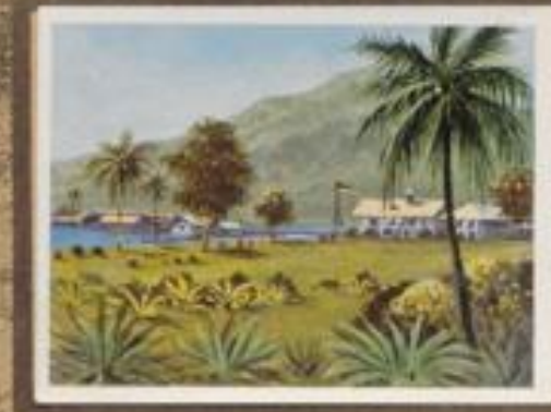
218 Eingeborenenhaus, aufgeschichtetes Haus am Karbente der Bismarckküste.