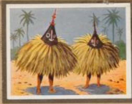
215 Tuf-Tuf-Tänzer. Der Tuf-Tuf genannte Gedehndanz besteht nur aus Männern, doch werden die und wieder auch alte Frauen aufgenommen. Der Tuf-Tuf veranstaltet Helle und Nacht Tänze und diese früher durch keine absolute Gewalt der Jungs und der öffentlichen Ordnung.