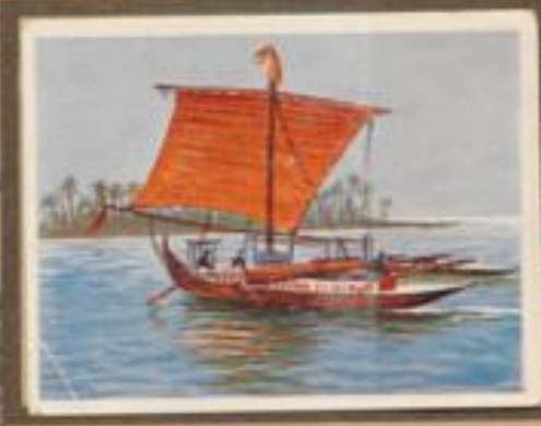
208 Auslegerboot der Südsee. Da die aus einem Baumstamm gebildeten Boote, bei denen die Segel tragen sollen, für die Seefahrt nicht stabil genug sind, werden sie durch eine Stützbrücke mit einem aus leichtem Holz gefertigten Schwimmer verbunden, um das Umkippen zu verhindern.