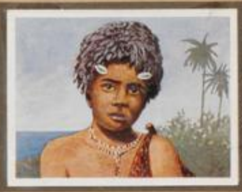
214 Junger Eingeborener. Bei den Bismarckländern (jeden Frauenraub und Mordtate nach einer heiligen Regel. Sie erliegen Strafe werden von den Göttern verpflegt.