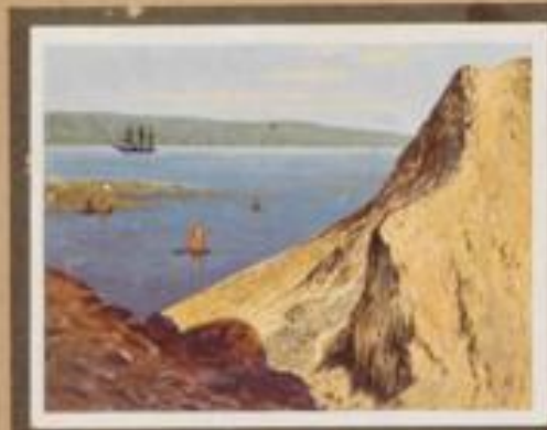
207 Sandstrand, der eingerammte Markt im Norden der Hauptinsel, Neupommern. Die gesamte Stadt steht durch ihre Stellung und die hier zum Meer abfließenden Bäche bei Ebbe auf einem hohen Niveau. Beste Östereisland am Rande, j. E. nach längerer Dürre und große Wasserstellen lassen die kulturreiche Landschaft wiederholt erscheinen.