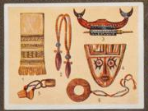
228 Eingeborenenkultur. 1 Kleidmaske für Männer (Genua). 2 Brust- und Nackenschmuck (Hama). 3 Totenkopf (Genua). 4 Maske (Hain-Indien). 5 Ohrgehänge (Genua). 6 Brustschmuck (Genua).