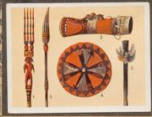
227 Waffen und Schutzwerkzeuge aus Neuguinea. 1 Speer von den Südseeindianern. 2 Oberer Teil eines Kampfeschildes (belegl.). 3 Tanztrommel (Hallerin-Sagaha-Stich). 4 Korb (belegl.). 5 Hand (belegl.).