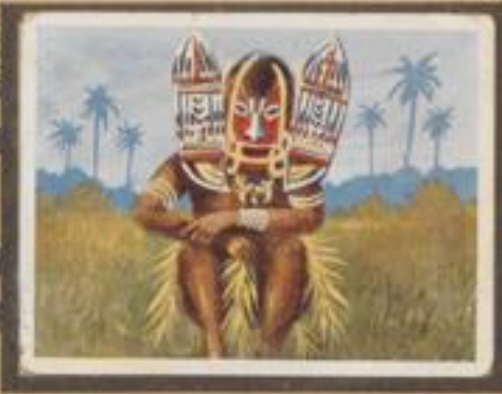
226 Südseeindianer mit Tanzmaske. Das Maskenwerk ist sehr oft durch die Männertrübe, die aus besonderen Anlässen Feste und Aufzüge mit einzelnen Masken oder ganzen Gruppen veranstalten.