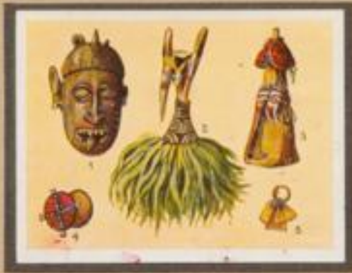
225 Masken von Neuseeländern und Ostseeindianern. 1 Eine einem Süd gerichtete Gesichtsmaske, deren Mund eine Waise einschließt. 2 Salzgehaltige Maske aus Wabenwachs. 3 Gesichtsmaske aus einem mit der Blattfaser einer Kokospalme überzogenen Holzstück. 4 Oberkopf von Totop. 5 Oberarmel von Hain.