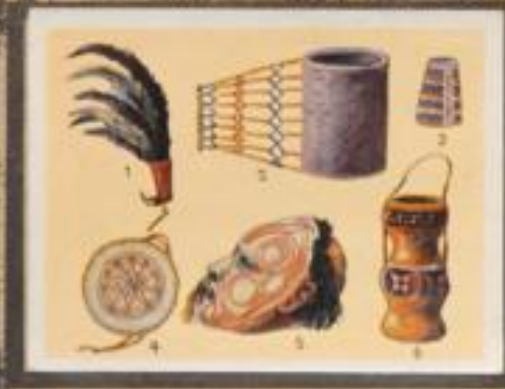
230 Schmuck und Kunst in Deutsch-Melanesien. 1 Helm mit Papagei- und Hahnenschubben. 2 Beinmanschette für Tote. 3 Beinarmband. 4 Stirnbandzeichen, auf der Brust getragen. 5 Erinnerungsjewelen an Tote (Schüssel). 6 Gefäß, aus Nocken geflochten und mit Haaren verziert.