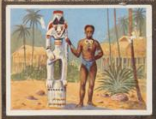
229 Holz aus Neuguinea. Der Hain- und Eibenholz bildet zur Verfertigung und Verehrung überlebensgroßer Figuren.