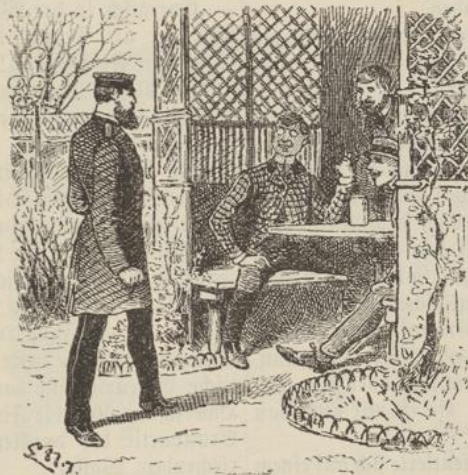
Bärmann empfand große Lust mit den Übermütigen anzubinden.

„Es ist eigentlich eine etwas verrufene Zahl!“ sagte die Alte, unter bedeutsamem Lächeln ihrem Mieter die geheimnisvollen Briefe überreichend. „Machen Sie das alberne Vorurteil gegen die Sieben