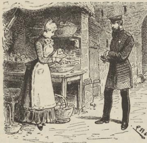
Statt der gemüthlichen Höckerin gewahrte er ein bildhübsches Mädchen, das statt ihrer hinter der Verkaufsbude stand.

Aber zwei Tage später saß trotzdem Herr Packmeister Bärmann abermals im Zimmer der Frau