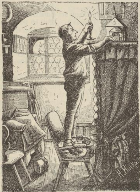
Darinnen erglänzten zwei Reihen Säulen, aufgebaut aus lauter blinkenden Dukaten.

Nachdem er sich gehörig ausgetobt, ging er kleinlaut nach Hause, unschlüssig darüber, was zu machen sei. Seine Frau, die ihm erwartungsvoll entgegen gekommen war, ließ er mit einigen schnurrigen Worten abfahren und verschloß sich in sein Zimmer. Die Nacht war indessen herangebrochen. Für Schlaumaier sollte es eine lange, schlaflose Nacht werden; denn in seinem Leben nie hatte er ein so schlechtes Spiel gespielt. Des andern morgens in aller Frühe begab er sich abermals in sein so teures Haus; er durchsuchte nochmals alle Winkel des Schatzzimmerchens und war eben im Begriffe, das in der Ecke liegende Testament zu entfalten, als plötzlich zwei Gendarmen unangeklopft in das Zimmer