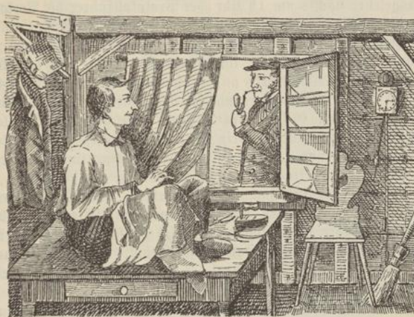
Da kam draußen nachlässigen Schrittes Nachbar Schlaumaier heran und grüßte freundlich.

Geldschätze könnten verborgen sein. Denn nur er unterfing sich, wie ein prüfender Kunstkenner da und dort eine zweifelhafte Stelle zu betasten oder zu beklopfen, als ob er sich von der Echtheit der Schnitzerei überzeugen wollte. Insbesondere schien eine Kapelle der Gegenstand seines forschenden Blickes zu sein, die in prächtiger Miniaturarbeit über dem Altoven zu Häfte in das Maßwerk eingelassen war. Mit dieser beschäftigte er sich noch, als schon alles das Gemach verließ. Dem Schneider, der den Mackler mit Argusaugen verfolgte, fiel dessen Gebahren auf. Zu seinem Staunen bemerkte er auch, daß der begeisterte Kunstliebhaber beim Hinausgehen seinen Stock in die Ecke des Schlafgemachs stellte, um ihn dort absichtlich zu vergessen. „Was gilt's“ murmelte er vor sich hin, „der Halunke hat in der