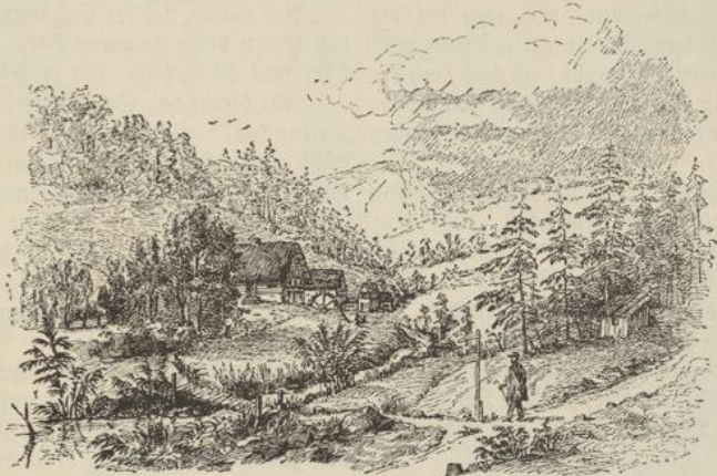
Mit einem halblauten „Gott sei Dank“ begrüßte unser Mann den ersehnten Unterschlupf.