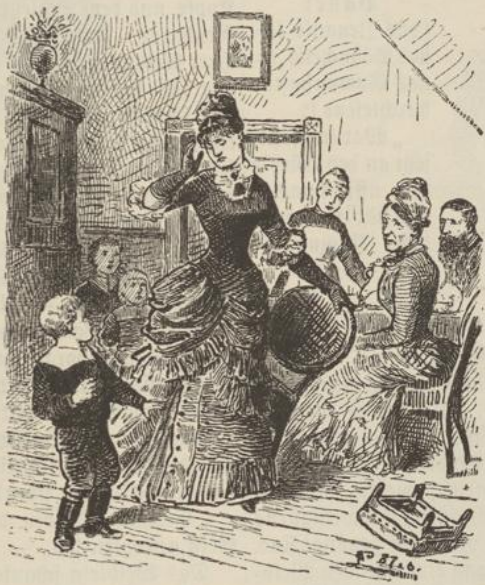
„Du unsauberer Bengel!“ schalt da mit einem Male die angehende Hausfrau, von ihrem Stuhle aufspringend.