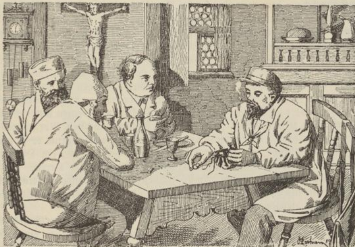
Der Fremde zog eine Schweinsblase heraus, die mit Goldmünzen gefüllt war und gab dem Wirt ein 20-Frankenstück.

finden einen glänzenden Rechenpfennig, den sie nach Hause brachten; — es war ein 20-Frankenstück. Die Eltern brachten den Fund zur Anzeige, und nun wurde auf gerichtliche Anordnung an der Fundstelle weiter nachgeforscht. Die Durchsichtung hatte ein überraschendes Ergebnis: einmal fand man noch weitere 3 Zwanzigfrankenstücke, dann aber — und das war von größter Wichtigkeit — die Mütze und den Stoc des Verunglückten, sowie ein blutbeflecktes, rotes baumwollenes Taschentuch. Zugleich aber entdeckte man die Stelle am Ufer, wo die Leiche vermutlich hinabgestürzt worden war. Trotz der stattgehabten Regengüsse sah man deutlich, daß der überhängende Uferrand abgebröckelt war, wie wenn ein schwerer Körper darüber hinweggeschleift worden