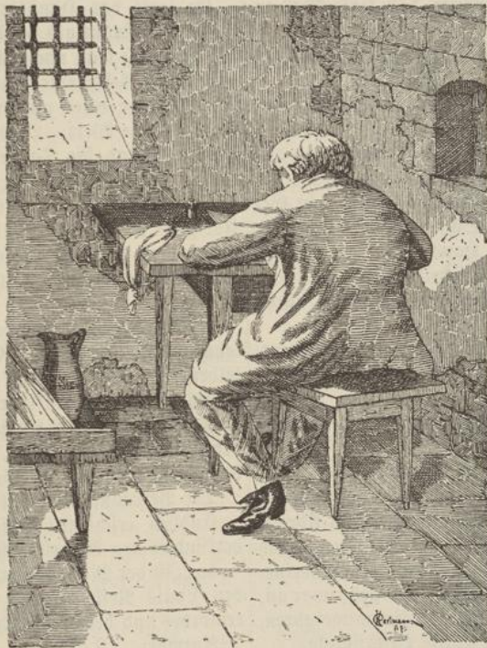
Eifrig schrieb der unglückselige Mann.

„Das weiß ich nicht bestimmt — ich glaube aber sie ist es.“