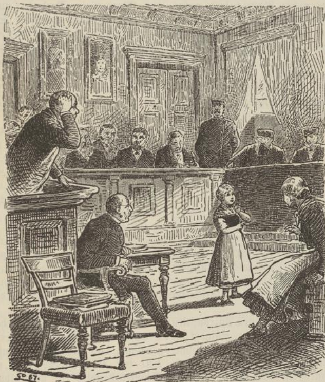
Das Kind sagte: „An dem Tage, wo du deinen Rock und die schönen roten Sacktücher verbrannt hast.“

Das alte Weiblein war halb tot vor Angst und besonders, als sie schwören sollte, kannte ihre Auf-