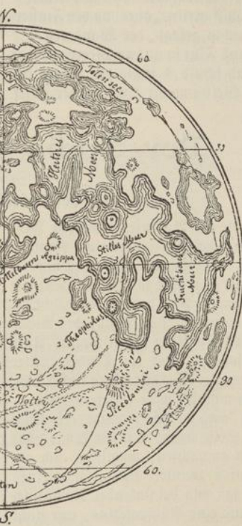
Karte des Mondes

„Soll gerne geschehen!“ sagte der Unterlehrer.