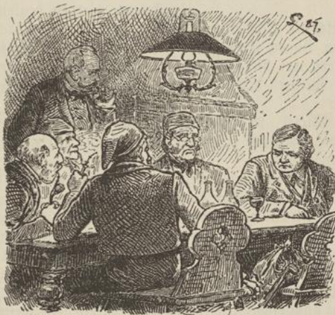
Der einen Augenblick vorher aufs höchste erregte Mann schwieg sichtlich betroffen.

Es war Winter gewor- den, tiefer Schnee bedeckte Berg und Thal. In der warmen getäfelten Stube der Erlenmühle saßen um den riesigen Kachelofen, eine ziemliche Anzahl Män- ner, welche einer Holzver- steigerung im nahen Do- mänenwalde angewohnt hatten. Unter ihnen be- fanden sich auch der Uhren- macher und der Schweine- händler, die an jenem ver- hängnisvollen Abend die