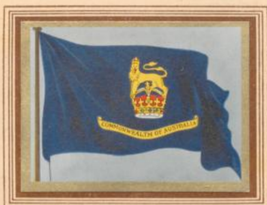
C 48 Australien — Flagge des Generalgouverneurs

Die Flagge des Generalgouverneurs von Australien beruht auf dem im Jahre 1930 für die Generalgouverneure aller Dominions durch König Georg V. gebilligten Entwurf, ist in Australien aber erst 1936 eingeführt worden. Vorher war die Flagge des Generalgouverneurs, der z. Zt. übrigens ein englischer Prinz ist, die britische Unionsflagge mit dem üblichen Mittelembem. Dieses bestand aus dem Commonwealth-Stern innerhalb eines Lorbeerkränzes, über dem Stern die britische Krone. Die Zahl der Strahlen des Sterns entsprach der jeweils gültigen Zahl der Sternstrahlen in der Nationalflagge.