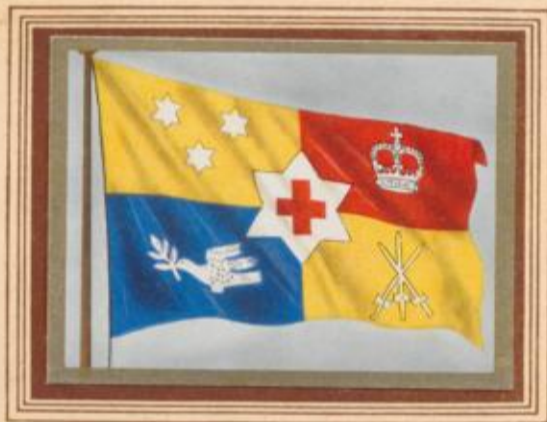
D 7 Tonga — Standarte der Königin

Seit über 30 Jahren regiert auf der Gruppe der Freundschaftsinseln, wie Tonga auch genannt wird, die größte Königin der Welt, Salote. Sie ist über 2 Meter groß. Die Königsstandarte ist der britischen im Aufbau nicht unähnlich. Ihr Gatte, der Premierminister, führt eine weißgeränderte rote Flagge mit einem weißen Kreuz in der Mitte. Früher war seine Flagge weiß-rot geteilt.