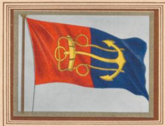
D 4 Neuseeland — Flagge des Marineamts

Die Handelsflagge von Neuseeland ist mit Admiraltätsschreiben vom 7. Februar 1899 geschaffen worden. Vorher gab es keine eigene Handelsflagge von Neuseeland. Die neuseeländischen Flaggen gelten auch auf den Cook-Inseln. Solange West-Samoa als Völkerbundsmandat unter neuseeländischer Verwaltung stand, führte es die Handelsflagge mit 3 Palmen auf einem Kreise statt der 4 Sterne.