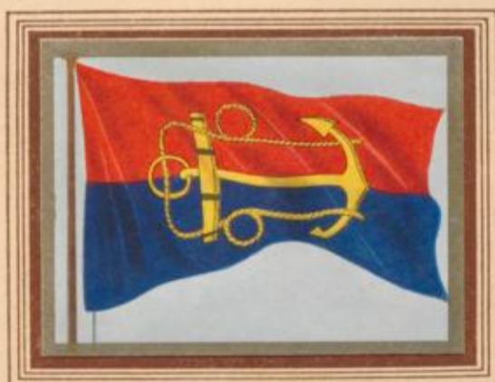
D 1 Australien — Flagge des Marineamts

Der große Stern unter dem Union Jack hatte von 1902, als die Flagge für das neue Commonwealth geschaffen worden ist, bis 1908 sechs Strahlen, die die sechs Teilstaaten bedeuten. Der 7. Strahl bezieht sich auf das inzwischen wichtiger gewordene Nordterritorium. Die Stellung der 5 kleineren Sterne zueinander wurde früher nicht sehr wichtig genommen, ist aber seit 1932 gemäß den wirklichen astronomischen Verhältnissen genau geregelt.