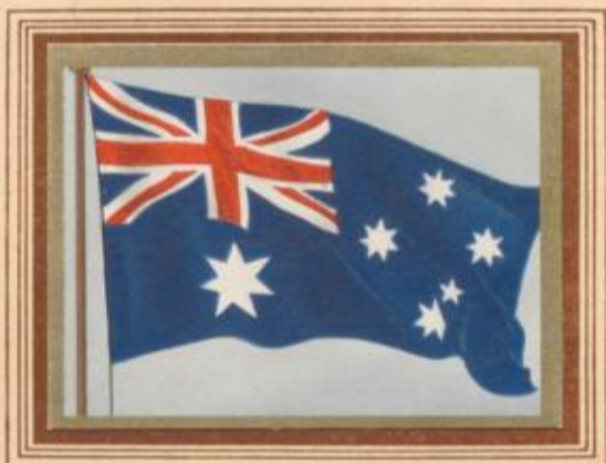
C 49 Australien — National- und Dienstflagge

Die Flagge des Generalgouverneurs von Australien beruht auf dem im Jahre 1930 für die Generalgouverneure aller Dominions durch König Georg V. gebilligten Entwurf, ist in Australien aber erst 1936 eingeführt worden. Vorher war die Flagge des Generalgouverneurs, der z. Zt. übrigens ein englischer Prinz ist, die britische Unionsflagge mit dem üblichen Mittelembem. Dieses bestand aus dem Commonwealth-Stern innerhalb eines Lorbeerkränzes, über dem Stern die britische Krone. Die Zahl der Strahlen des Sterns entsprach der jeweils gültigen Zahl der Sternstrahlen in der Nationalflagge.