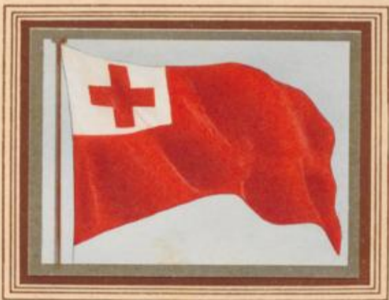
D 8 Tonga — Nationalflagge

Seit über 30 Jahren regiert auf der Gruppe der Freundschaftsinseln, wie Tonga auch genannt wird, die größte Königin der Welt, Salote. Sie ist über 2 Meter groß. Die Königsstandarte ist der britischen im Aufbau nicht unähnlich. Ihr Gatte, der Premierminister, führt eine weißgeränderte rote Flagge mit einem weißen Kreuz in der Mitte. Früher war seine Flagge weiß-rot geteilt.