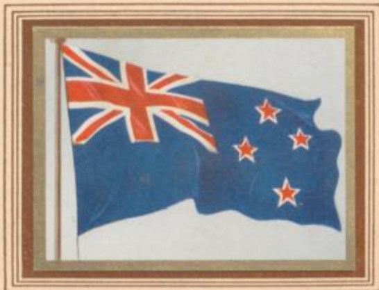
D 2 Neuseeland — National- und Dienstflagge

Die Flaggen von Neuseeland unterscheiden sich von den australischen nicht sehr auffällig. Das wesentlichste Merkmal ist das Fehlen des großen Commonwealth-Sterns. Das Kreuz des Südens enthält in der neuseeländischen Flagge auch nur 4 und nicht 5 Sterne. Die blaue Flagge mit den roten weißgeränderten Sternen ist schon 1868 eingeführt worden. Seltsamerweise hat sich in den Flaggenlisten die nur von 1834—1840 gültige Flagge von Neuseeland sehr lange erhalten, die heute noch von der Reederei Shaw, Savill & Co. als Hausflagge geführt wird.