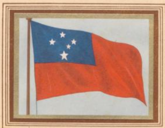
D 6 Westsamoa — Landesflagge

Nachdem Westsamoa aus einem Völkerbundsmandat in ein Treuhandgebiet der Vereinten Nationen umgewandelt worden ist und eine eigene Verfassung erhalten hat, hat es 1948 eine besondere Flagge angenommen, die neben der Flagge der neuseeländischen Treuhandmacht gesetzt wird. Nach etwa einem Jahr wurde die Oberecke abgeändert, so daß das Kreuz des Südens jetzt mehr dem australischen als dem neuseeländischen Muster ähnelt.