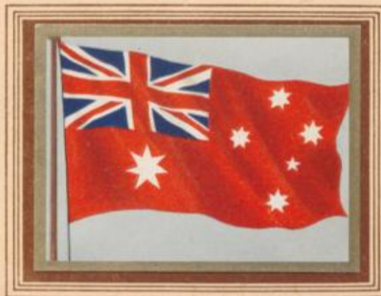
C 50 Australien — Handelsflagge

Im Gegensatz zu Kanada gilt in Australien nicht die rote, sondern die blaue Flagge als die allgemein übliche. Das mag seinen Vorläufer darin haben, daß die Flagge des Teilstaates Victoria das Motiv geliefert hat und daß die 5 Sterne des Südlichen Kreuzes, des schönsten Sternbildes des südlichen Himmels, in blauem Grunde natürlicher stehen als in rotem. Die blaue Flagge machte im übrigen die gleichen Veränderungen durch wie die rote.