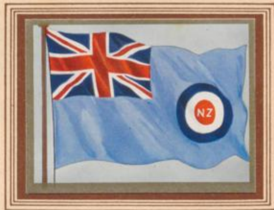
D 5 Neuseeland — Flagge der Luftwaffe

Die Flagge des neuseeländischen Navy Board unterscheidet sich von denen der anderen Dominions dadurch, daß der rote Flaggenteil am Liek und der blaue am fliegenden Ende steht. Die Flagge wurde 1937 eingeführt. Der Generalgouverneur hat ebenfalls die dem allgemeinen Schema entsprechende Generalgouverneursflagge mit der Inschrift: „Dominion of New Zealand“ auf dem goldenen Schriftband (vgl. Australien C 48).