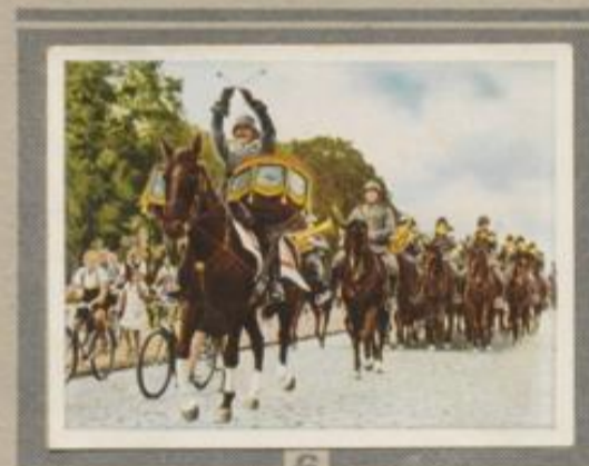
6 Kesselpauker. Die Kavallerieregimenter der alten Armee hatten z. T. Kesselpauken. Sie werden im heutigen Heere, meist von Reiter- und Artillerieregimenten, weitergeführt.