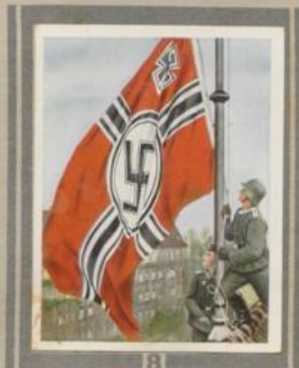
8 Die Deutsche Kriegsfahne. Am 7. November 1935 wurde die vom Führer der Wehrmacht verliehene neue Kriegsfahne zum erstenmal gehißt. Bei Gedenkfeiern kann neben ihr auf Anordnung auch die alte schwarz-weißrote gezeigt werden.