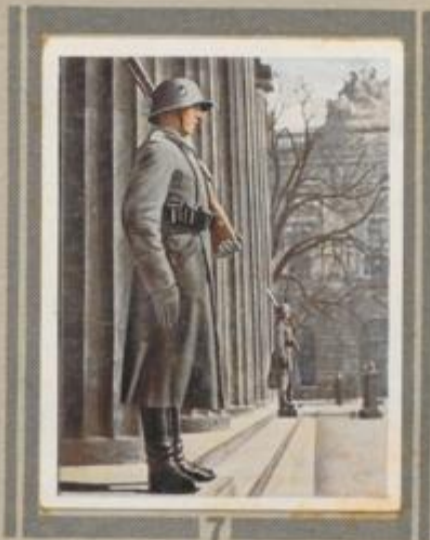
7 Posten am Ehrenmal. Das Berliner Ehrenmal steht unter der besonderen Obhut unserer neuen Wehrmacht. Die ablösende Wachkompanie marschiert an ihm mit klingendem Spiel vorbei.