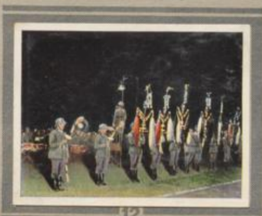
12 Festerlicher Zapfenstreich. Ein „großer“ Zapfenstreich ist ein hinreichendes Schauspiel. Seine Wirkung ist um so gewaltiger, je größer die Zahl der Musiker, Spielleute und Fackelträger ist.