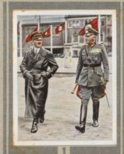
1 Führer und Reichskriegsminister. Oberster Befehlshaber der Wehrmacht ist der Führer. Unter ihm befehligt über Heer, Kriegsmarine und Luftwaffe der Reichskriegsminister und Oberbefehlshaber Generalfeldmarschall v. Blomberg.