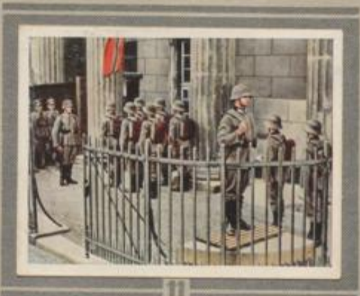
11 Wachablösung am Brandenburger Tor. Auch die äußeren Formen des Wachdienstes helfen die Manneszucht fördern. Straffe Posten und stramme Ablösungen erhöhen beim Volksgenossen und Ausländer das Ansehen unseres Heeres.