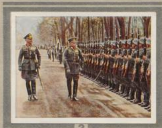
3 Generaloberst v. Seckt. Der Schöpfer der in der Nachkriegszeit gebildeten Reichswehr wurde in Anerkennung seiner hervorragenden Verdienste als Chef des Infanterieregiments 67 mit der heutigen Wehrmacht aufs ehrenvollste verbunden.