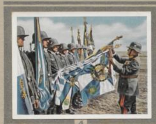
4 Ehrung der Fahnen der alten Armee. Am 17. März 1935, dem Tag der Verkündung deutscher Wehrhoheit, ließ der Führer die Feldzeichen der alten Armee mit dem Kriegskreuz schmücken. Im Herbst 1936 bekam das Heer die ersten der am 5. Oktober 1935 verliehenen eigenen Fahnen.