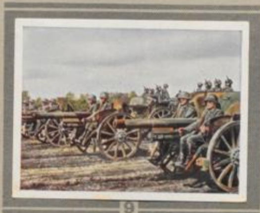
9 Parademarsch der Artillerie. Der Vorbeimarsch der Artillerie bei Paraden erfolgt im Schritt, Trab oder Galopp, meistens in Batteriefronten. Pferde und Geschütze in scharfer Richtung zu halten, ist eine nur schwer zu erlernende Kunst.