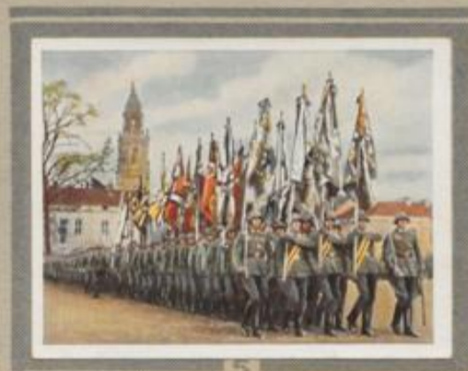
5 Fahnenkompanie. Zu nationalen Gedenktagen werden die an historischen Stätten ruhenden Fahnen der alten Armee durch Fahnenkompanien abgeholt. Unser Bild zeigt eine solche vor der Potsdamer Garnisonkirche.