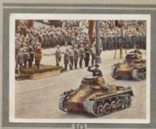
10 Parade der Panzertruppen. Am 20. April 1936, dem Geburtstag des Führers, erregte die im Zeichen der wiedererrungenen Wehrhoheit neu gebildete Kraftfahr-Kampfstuppe besondere Begeisterung — vor allem ihre Tanks und ihre Spähwagen.