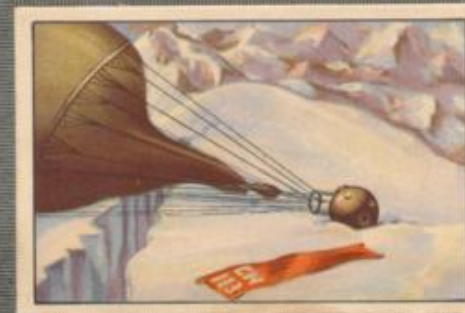
Nr. 12 Piccards Höhenforschungs- ballon landet in den Alpen