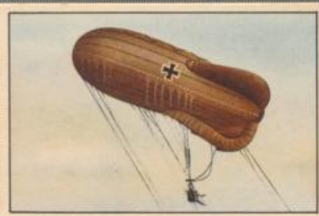
Nr. 5 Drachenfesselballon (System Bartsch v. Sigsfeld.)