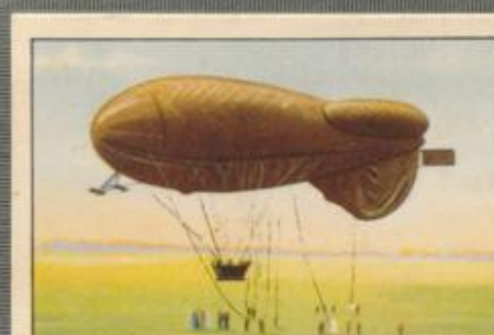
Nr. 6 Stromlinienförmiger Fesselballon Gebaut 1918 in der Ballonfabrik von Riedinger, Augsburg. Inhalt: 1000 cbm.