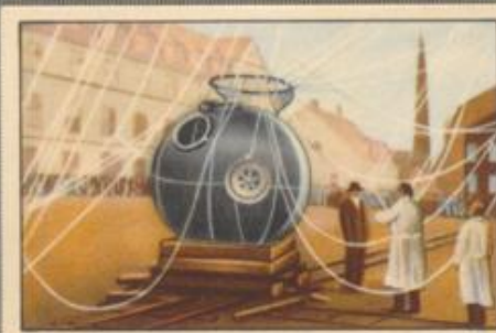
Nr. 3 Netzloser Höhenforschungsballon (Piccard) Er erreichte eine Höhe von 16 000 m.