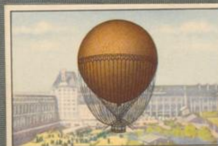
Nr. 4 Kugelfesselballon Dieser Ballon wurde auf der Pariser Weltausstellung 1878 als besondere Sehenswürdigkeit vorgeführt.