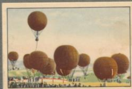
Nr. 9 1. Deutscher Freiballon- Wettbewerb