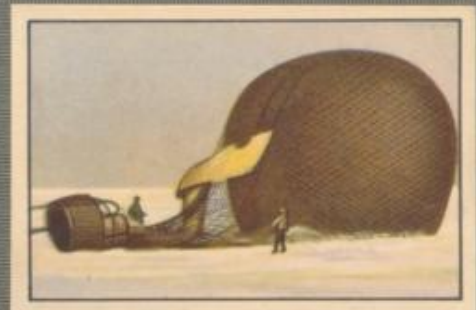
Nr. 8 Andrees Ballon nach der Auffindung