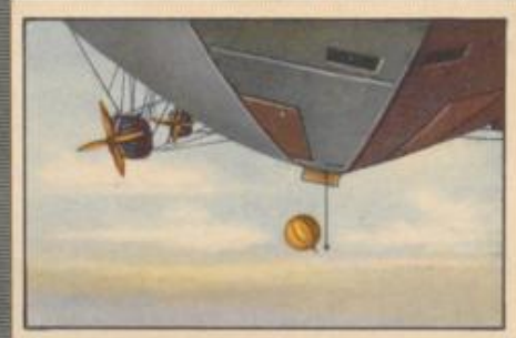
Nr. 10 Fesselballon Aufstieg anlässlich der Zeppelin-Arktis- Expedition.