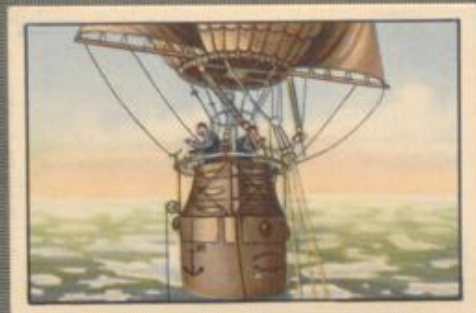
Nr. 7 Andrees Polarflug Aufstieg