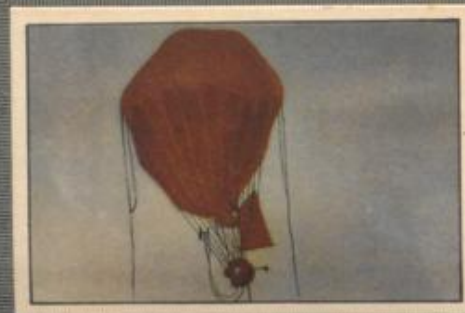
Nr. 11 Aufstieg des Piccardschen Höhenforschungsballons