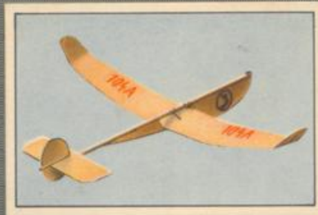
Nr. 8 Winkler Es legte 1930 eine Luftstrecke von 2780 m zurück.