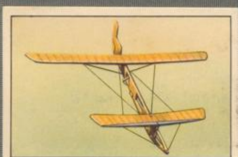
Nr. 4 Ente