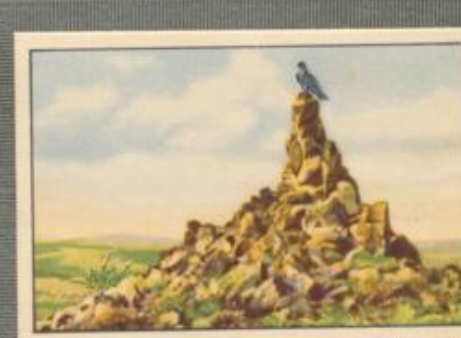
Nr. 12 Flieger-Denkmal auf der Rhön