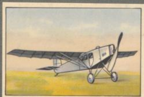
Nr. 2 Rumpf-Modell