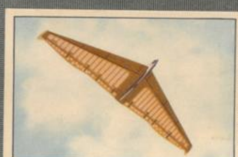
Nr. 6 Nurflügel-Modell