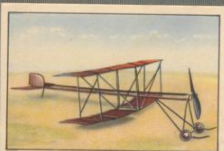
Nr. 3 Doppeldecker