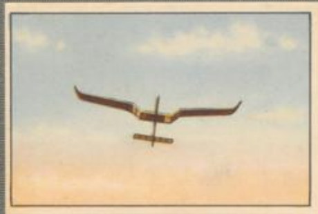
Nr. 1 Stab-Modell