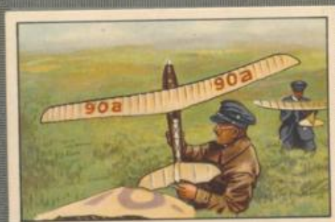
Nr. 9 Tzschope Es erreichte 1930 die größte Flugdauer von 3 Minuten 23 Sekunden.