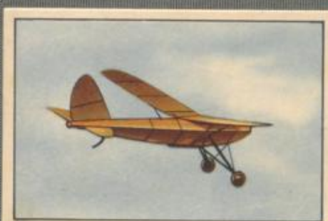
Nr. 5 Motor-Modell