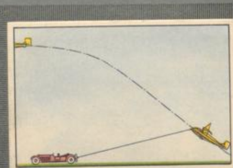
Nr. 11 Autostart zum Segelflug Durch diese Startmethode wurde der Segelflug-Sport in der Ebene erst möglich.