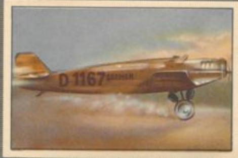
Nr. 14 Start der „Bremen“ in Baidonell (Irland)

Landung des Heinkel-Flugzeuges in der Vergö-Bey anlässlich der schwedischen Rettungs-Expedition für Nobille im Jahre 1928