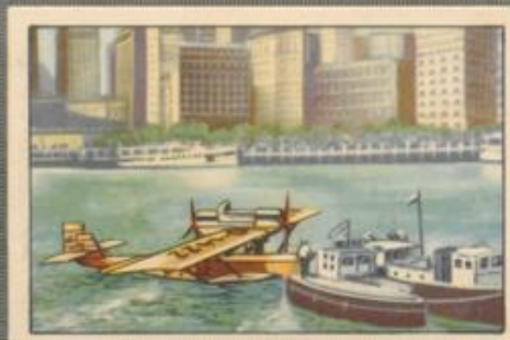
Nr. 15 Gronau in New York

zum Fluge nach Amerika mit Köhl, Hünefeld und Fitzmaurice.