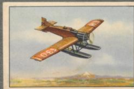
Nr. 17 Mittelholzers Flug nach Afrika

Mittelholzer flog mit diesem Dornier-Merkur bis zum Killimandscharo (früh. Deutsch-Ost-Afrika).