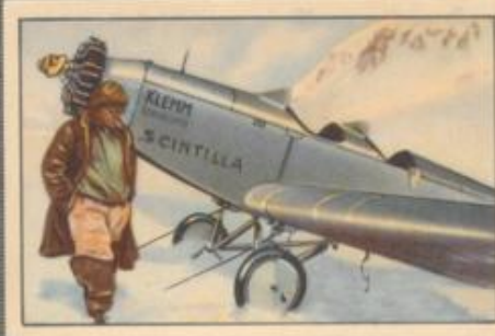
Nr. 8 Udet landet auf dem Plateau de Triente (Montblanc)