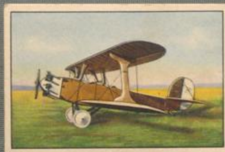
Nr. 3 B. F. W. U 12b „Flamingo“ Schul- und Kunstflugdoppeldecker, 2-sitziges Sportflugzeug. 100-PS-Siemens Sh 14 Motor, luftgekühlt.