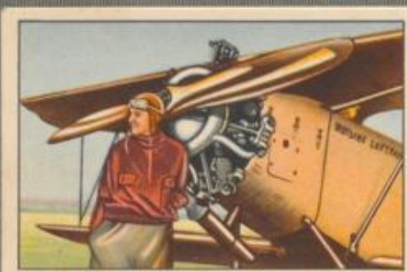
Nr. 9 Elli Beinhorn mit ihrem Flugzeug Fräulein Beinhorn erhielt als erste Sport- fliegerin das silberne Abzeichen.