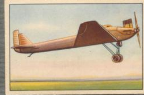
Nr. 18 Der erste Flug des Junkers Stratosphären-Flugzeuges Ju 49 am 2. 10. 31.

Mittelholzer flog mit diesem Dornier-Merkur bis zum Killimandscharo (früh. Deutsch-Ost-Afrika).