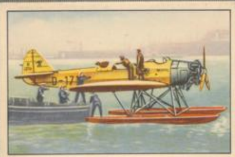
Nr. 7 Erste Katapult-Post Übergabe der ersten Katapult-Post im New Yorker Hafen.