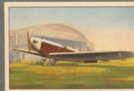
Nr. 4 Klemm L 20 2-sitziges Sportflugzeug. 20-PS-Mer- cedes Flugmotor, luftgekühlt. (Hinden- burg-Pokalsieger Freiherr von König- Werthausen auf dem Weltrundflug in Tokio.)