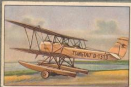
Nr. 1 Heinkel HD 24 W „Tsingtau“ 2-sitziges Sportflugzeug auf Schwimmern für Günther Plüschow. 230-PS-BMW IV Motor, wassergekühlt.