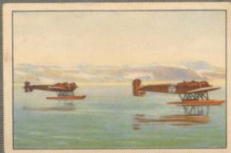
Nr. 13 Heinkel-Flugzeug in der Vergö-Bey

Landung des Heinkel-Flugzeuges in der Vergö-Bey anlässlich der schwedischen Rettungs-Expedition für Nobille im Jahre 1928