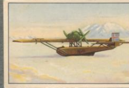
Nr. 12 Amundsens Dornier-Wal im Polar-Eis anlässlich der Nordpol-Expedition im Jahre 1925.