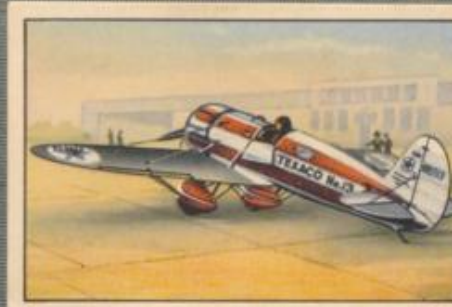
Nr. 10 Flugzeug des Captain Hawks Hawks legte die fast 1000 km lange Strecke London—Berlin in 2 Stunden 57 Minuten zurück.