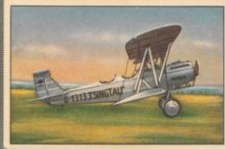
Nr. 2 Heinkel HD 24 L „Tsingtau“ 2-sitziges Sportflugzeug auf Landfahr-gestell für Günther Plüschow. 230-PS-BMW IV Motor, wassergekühlt.