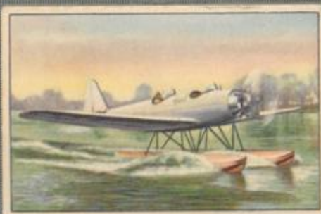
Nr. 3 Junkers L 50 „Junior“ 2 sitziges Sportflugzeug auf Schwim- mern. 80-PS-Siemens Sh 13 Motor, luft- gekühlt.