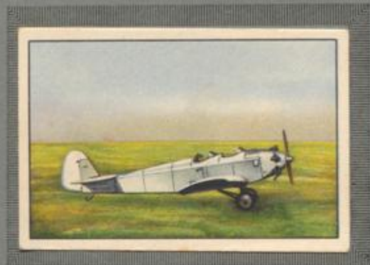
Nr. 9 Klemm L 26 IIa 2 sitziges Sportflugzeug. 80/100-PS-Sie- mens Sh 13 Motor, luftgekühlt.