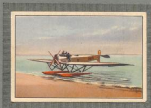
Nr. 20 Heinkel S I 2 sitziges Sport- und Übungsflugzeug auf Schwimmern. 360-PS-Rolls Royce Eagle Motor, wassergekühlt.