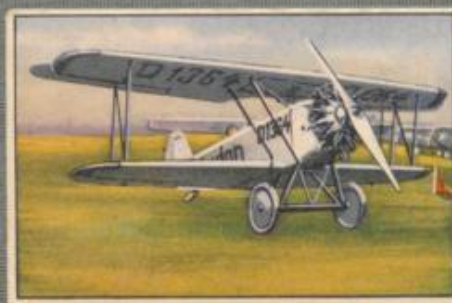
Nr. 27 Raab-Katzenstein KI 1c 2 sitziger Sportdoppeldecker. 80-PS- Siemens Sh 12 Motor, luftgekühlt.