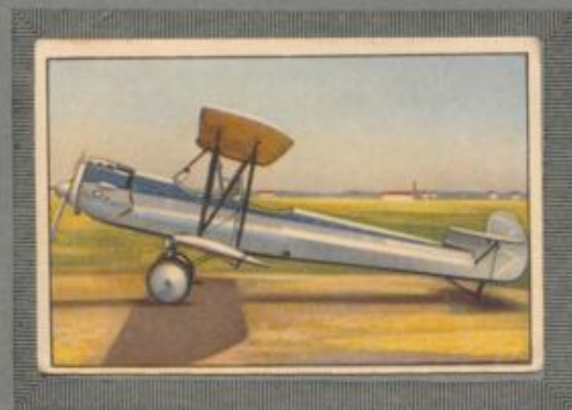
Nr. 11 Albatros L 82 a 2 sitziger Sportdoppeldecker. 100-PS- de Haveland-Motor, luftgekühlt.