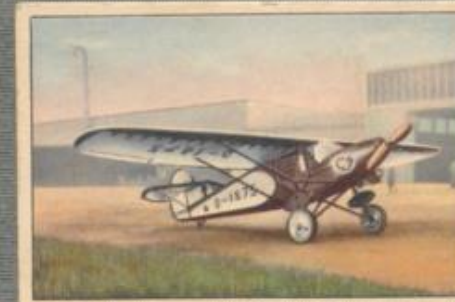
Nr. 30 Arado L IIa 2 sitziger Sporthochdecker. 100-PS- Argus As 8 Motor, luftgekühlt.