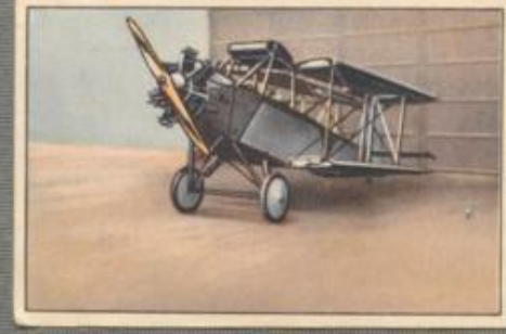
Nr. 26 Messerschmitt B.F.W. M 21 2 sitziger Sportdoppeldecker. 115-PS- Siemens Sh 12 Motor, luftgekühlt.