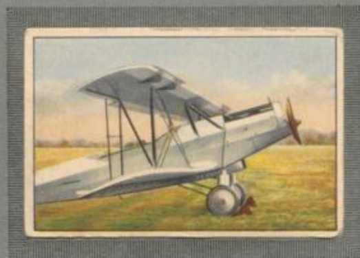
Nr. 15 Albatros L 75a ass 2 sitziger Übungsdoppeldecker mit automatischem Handley-Page Schlitz- flügel. 320-PS-BMW Va Motor, wasser- gekühlt.