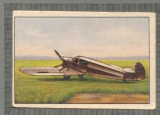
Nr. 12 Albatros L 100 Sporttiefdecker mit 3 sitziger Kabine. 100-PS-Argus As 8 Motor, luftgekühlt.