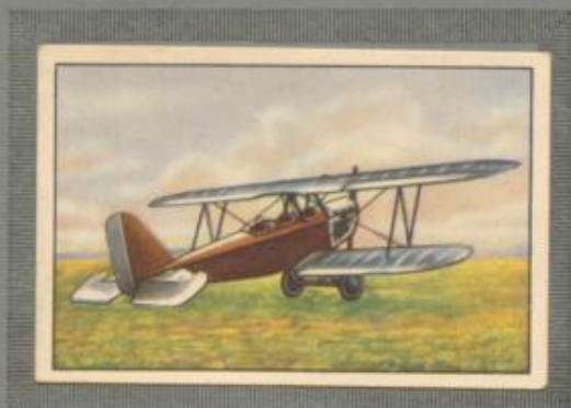
Nr. 19 Heinkel HD 29 3 sitziges Sport- und Übungsflugzeug. 100-PS-Mercedes-Motor, wassergekühlt.