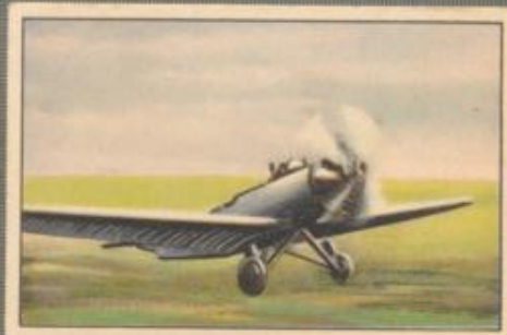
Nr. 2 Junkers L 50 „Junior“ 2 sitziges Sportflugzeug auf Landfahr- gestell. 80-PS-Siemens Sh 13 Motor, luft- gekühlt.