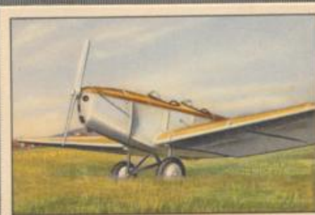
Nr. 4 Klemm L 25 VIIb 2 sitziges Sportflugzeug. 65-PS-Hirth- Motor, luftgekühlt.