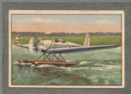
Nr. 23 Messerschmitt B.F.W. M 23bw 2 sitziges Sportflugzeug auf Schwimm- ern. 80-PS-Siemens Sh 13 Motor, luft- gekühlt.