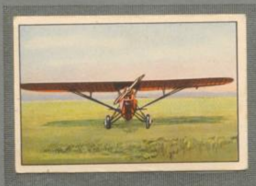
Nr. 13 Albatros L 101 2 sitziger Sporthochdecker. 100-PS- Argus As 8 Motor, luftgekühlt.