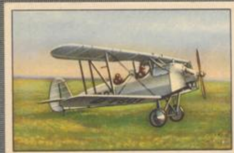
Nr. 33 Focke-Wulf S 24 „Kiebitz“ 2 sitziger Sportdoppeldecker. 70-PS-Siemens Sh 13 Motor, luftgekühlt.