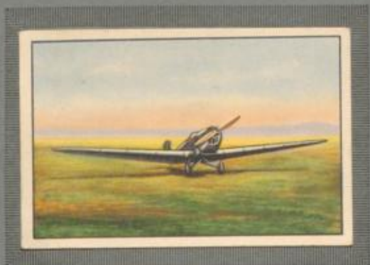
Nr. 7 Klemm L 25 E I 2 sitziges Sportflugzeug. 80/100-PS Argus As 8 Motor, luftgekühlt.