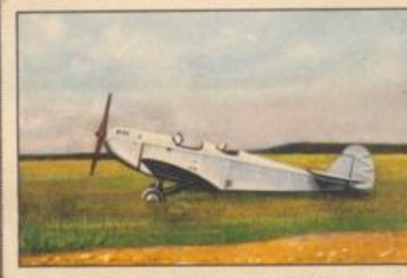
Nr. 6 Klemm FL 27 Va Frachtleichtflugzeug. 80/100-PS-Argus As 8 Motor, luftgekühlt.