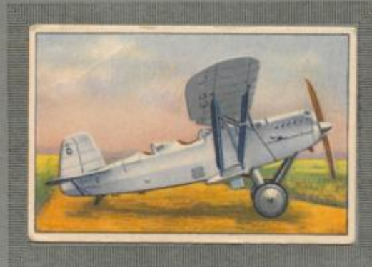
Nr. 16 Albatros L 76 „Aeolus“ 2 sitziger Übungsdoppeldecker. 490-PS- BMW VI Motor, wassergekühlt.