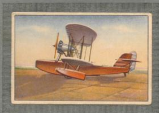
Nr. 21 Heinkel HD 55 Flugboot. 500/600-PS-Siemens Jupiter VI Motor, luftgekühlt.