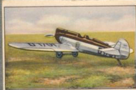
Nr. 28 Raab-Katzenstein RK 25 2 sitziger Sporthochdecker für Schnell- reisen. 80-PS-Citrus Mark II Motor, luft- gekühlt.