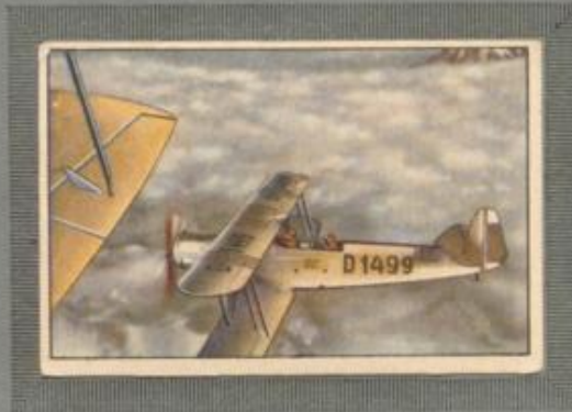
Nr. 14 Albatros L 75 ass 2 sitziger Übungsdoppeldecker. 320-PS- BMW Va Motor, wassergekühlt.