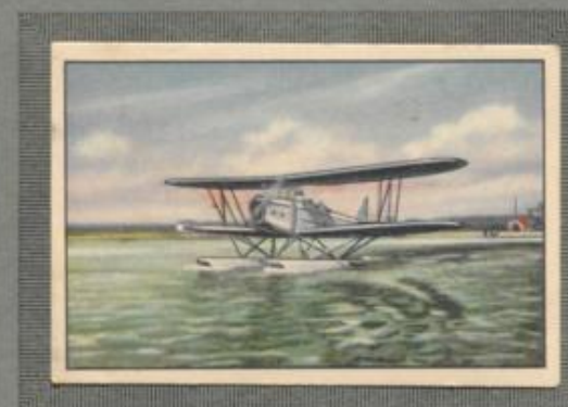
Nr. 17 Heinkel HD 42 2 sitziges Schul- und Übungsflugzeug auf Schwimmern.