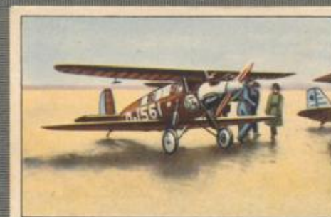
Nr. 35 Darmstadt D 18 Freitragender Sportdoppeldecker mit 2 sitziger Kabine. 100-PS-Siddeley „Genet“ Motor, luftgekühlt.