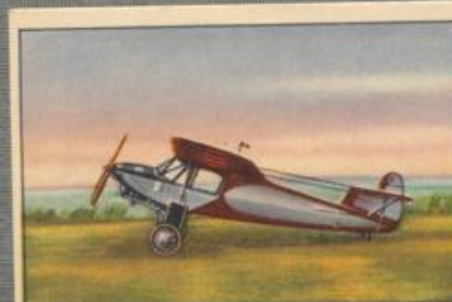
Nr. 29 Arado „Treff Ass“ 2 sitziger Sport- und Reisehochdecker. 80-PS-Argus As 8 Motor, luftgekühlt.