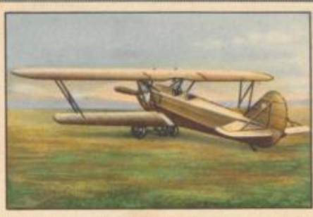
Nr. 32 Arado SC II 2 sitziger Übungsdoppeldecker. 350-PS-BMW IV Motor, wassergekühlt.