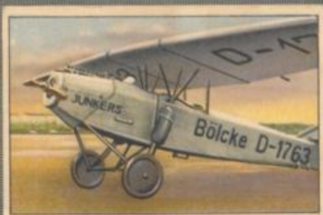
Nr. 1 Junkers T 26 E 2 sitziges Sportflugzeug. 80-PS-Junkers L 1 Motor, luftgekühlt.