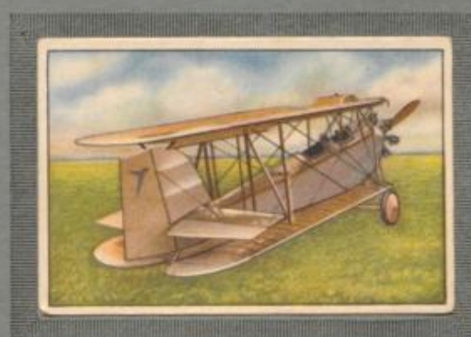
Nr. 22 Messerschmitt B.F.W. M 21 2 sitziger Sportdoppeldecker. Trag- flächen zum Transport beigelegt.