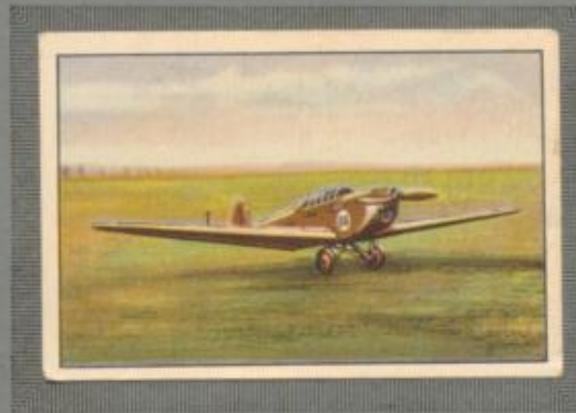
Nr. 8 Klemm L 25 E II 2 sitziges Sportflugzeug mit Kabine. 80/100-PS-Argus As 8 Motor, luftgekühlt