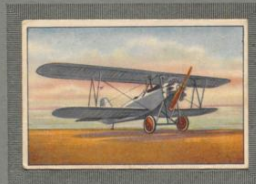
Nr. 18 Heinkel HD 32 2 sitziges Sport- und Übungsflugzeug. 100-PS-Siemens Sh 12 Motor, luftgekühlt.