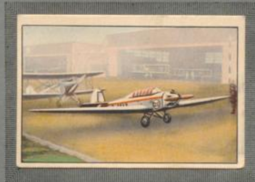
Nr. 10 Klemm L 25 IVa 2 sitziges Sportflugzeug mit Kabine. 100-PS-Genet-Motor, luftgekühlt.