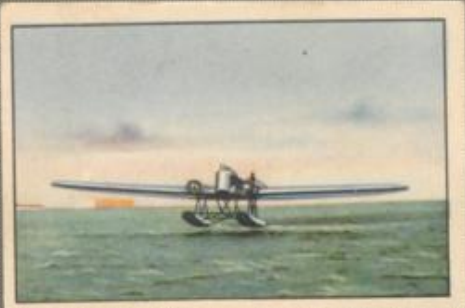
Nr. 31 Arado W II 2 sitziges Übungsflugzeug auf Schwimmern. 2x100-PS-Siemens Sh 12 Motoren, luftgekühlt.