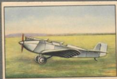
Nr. 5 Klemm L 26 IIIa 2 sitziges Sportflugzeug. 85/95-PS-Cirrus Mark III Motor, luftgekühlt.