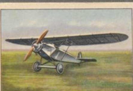
Nr. 36 Hüffer HB 26 „Bajadere“ 2 sitziger Sporthochdecker. 60-PS-Anzani-Motor, luftgekühlt.