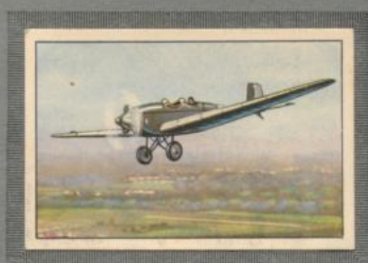
Nr. 24 Messerschmitt B.F.W. M 23b 2 sitziges Sportflugzeug auf Landfahr- gestell. (Siegerflugzeug im 1. Europa- rundflug 1929.) 80-PS-Siemens Sh 13 Mo- tor, luftgekühlt.