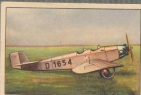
Nr. 5 Klemm L 25 2 sitziges Sportflugzeug. 40-PS-BMW X Motor, luftgekühlt.