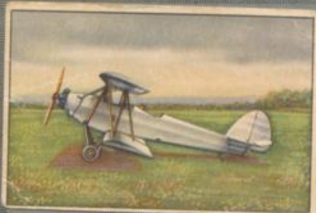
Nr. 3 Raab-Katzenstein RK 9a „Grasmücke“ 2 sitziger Sportdoppeldecker. 40-PS-Salmson-Motor, luftgekühlt.