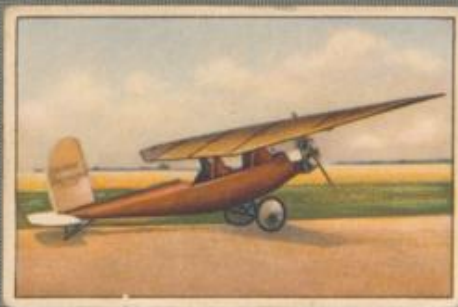
Nr. 1 Espenlaub E 12 2 sitziger Sporthochdecker. 35-PS-Anzani-Motor, luftgekühlt.