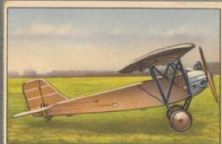
Nr. 2 Albatros L 66a 1 sitziger Sporthochdecker. 35-PS-Mark-Motor, wassergekühlt.