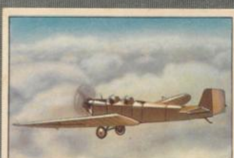
Nr. 6 Klemm L 25 la 2 sitziges Sportflugzeug, 40-PS-Salmson-Motor, luftgekühlt.