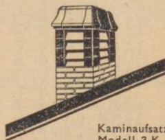
Kaminaufsatz Modell 3 K

Doppelkamin für Heizung, Gas und Lüftung