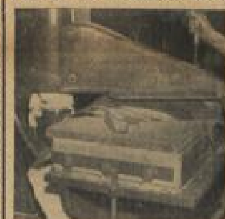
Eine Lederstanz für Sohlenleider