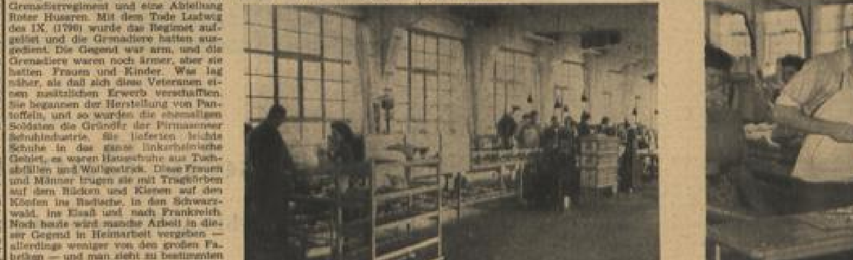
Diese beiden Bilder zeigen Ausschnitte aus der Handfabrikation der California-Schuhe (siehe auch Bild auf der ersten Seite). Auf dem Bild links sind die drei Infrarot-Heizstrahlen zu sehen