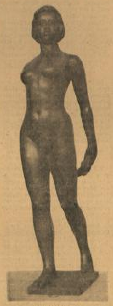
Ella de France