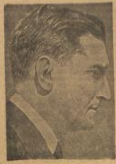
Portugiesischer Staatsoberhaupt, Präsident Salazar