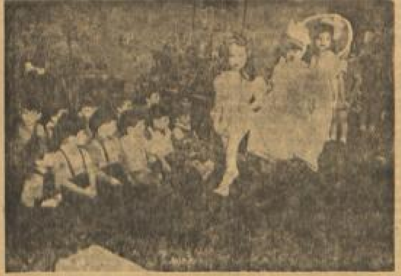
MOEN SCHON IM PROLETARIAT ALTES! In New York sind eine signierte Millionen sind. Die kleinen Mannes haben ihren einen jungen Kameraden die letzten Jahre seine wert

ROME. — Une vive effervescence règne actuellement dans plusieurs villes d'Italie en raison de la pénurie de vivres, de la cherté de la vie et de l'insuffisance des salaires. A Foggia, dans les Pouilles, des incidents à caractère politique se sont déroulés dernièrement. Le « Giornale della Sera » signale que des groupes d'action communistes armés circulent dans les environs de la ville. On enregistre, d'autre part, des grèves importantes qui ne font que se succéder les unes aux autres. Tous les restaurants romains ont refusé d'ouvrir leurs portes, vendredi, en signe de protestation contre les restrictions alimentaires imposées par le conseil des ministres et la répression du marché parallèle qui leur permettait de compléter leur approvisionnement. En outre, 120.000 instituteurs et institutrices menacent de se mettre en grève, lundi, dans toute l'Italie si leurs revendications au sujet des augmentations de traitement ne sont pas acceptées par le gouvernement.