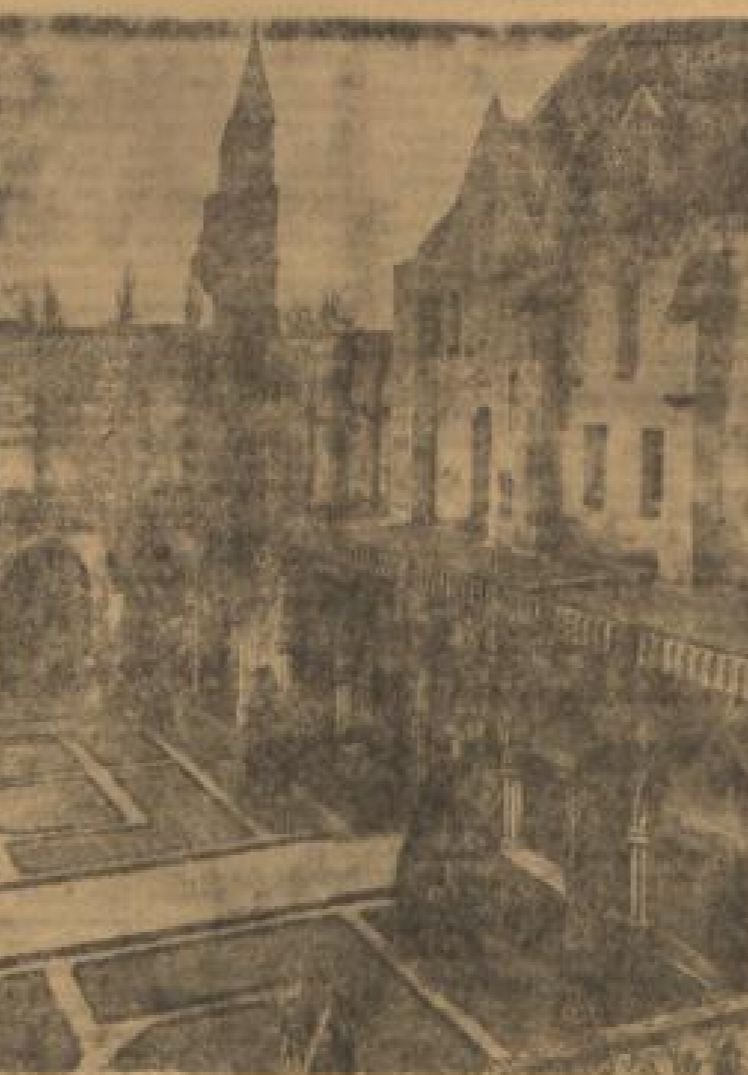
in Frieden und in Frieden sich ...