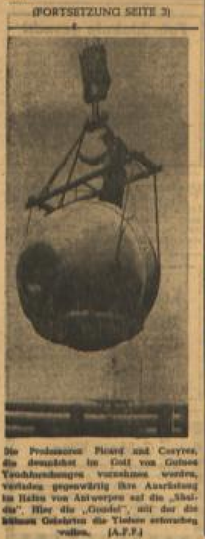
Die Professoren Pflanz und Coeyres, die demnach im Ost von Ostsee...