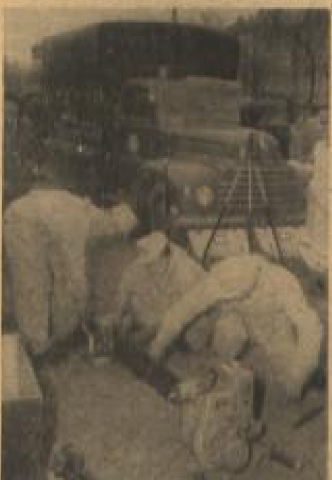
Der erste motorisierte Betriebskraftwagen des technischen Hilfswerkes wurde in Düsseldorf vorgeführt. Der Betriebskraftwagen, ein Lastkraftwagen von 1,5 Tonnen, ist auf Grund längerer Erfahrungen und Beobachtungen mit allen für die notwendigen Hilfeleistungen bei Katastrophen erforderlichen Werkzeugen ausgerüstet.

Paris. (dpa) Im Palais Chaillet in Paris trafen am Dienstagmorgen die Mitglieder des Dreimächte-Militärausschusses (Standing-group) und die des ständigen NATO-Rates zur Erörterung einer Reihe militärischer, strategischer und finanzieller Fragen zusammen. Die Beratungen begannen mit einem Bericht der Mitglieder des dreiköpfigen ständigen Militärausschusses (Standing-group).