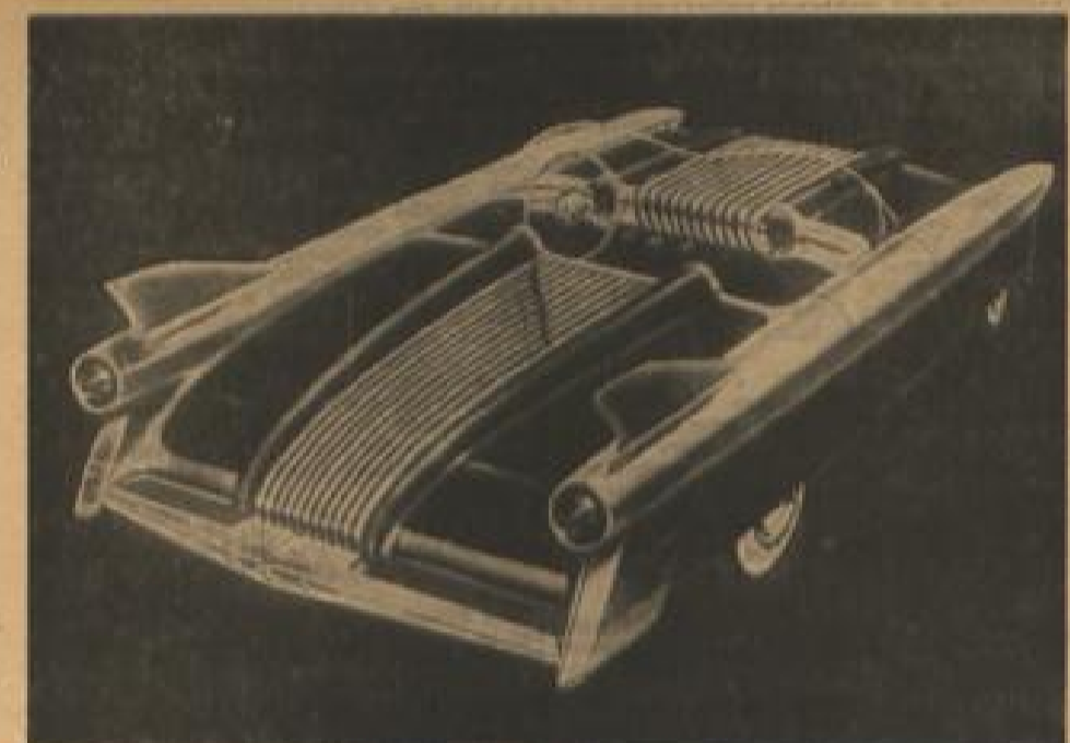
Ein Alptraum der Landstraße