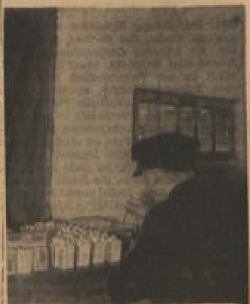
Blinder beim Verpacken der Landolinseife

sten Schritt in dieser Richtung hat er getan. Sein Beispiel hat gezeigt, daß der Blinde im wirtschaftlichen Konkurrenzkampf seinen Mann stellen und mehr leisten kann, als man von ihm gewöhnlich erwartet.