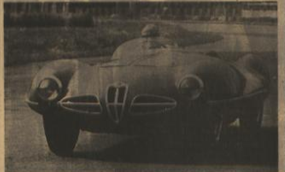
Mit diesem Alfa Romeo starteten die Italiener nach dem Kriege zu großen Rennen gegen ihre gefährlichsten Gegner: Ferrari. Sie konnten, obwohl das Fahrzeug eine Spitzengeschwindigkeit von 200 km/h erreichte, die Vorherrschafft des Konkurrenzwerkes allerdings nicht brechen.