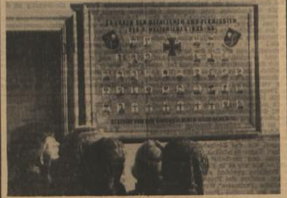
Mahnend blicken die Bilder der Toten und Vermissten im Kommandantenhaus der Feste Dilsberg auf die junge Generation, die in wenigen Jahren die Geschichte der Gemeinde und des Landes in ihre Hände nehmen wird. An diesen Jungen und Mädchen wird es liegen, ob wieder ein blühendes Deutschland entsteht. Der Volkstrauertag zum Gedächtnis der Toten beider Weltkriege mahnt zur Einheit und Besinnung.