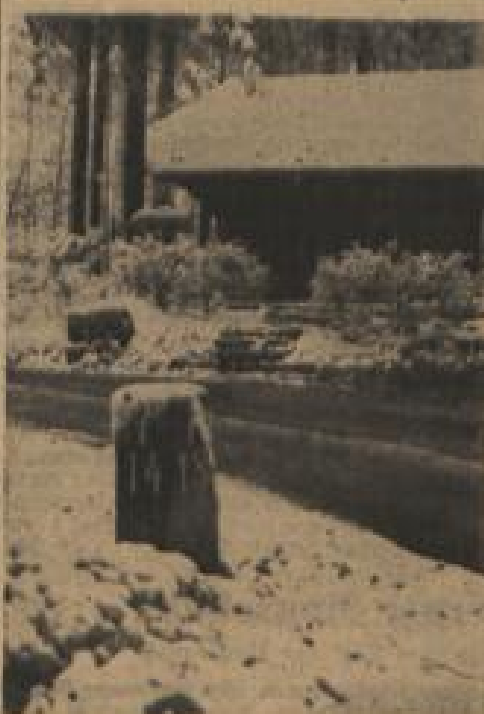
Die Bilder hier sind ganz frisch importiert. Oh — glaubt es mir! Da ist nichts reuschliert...