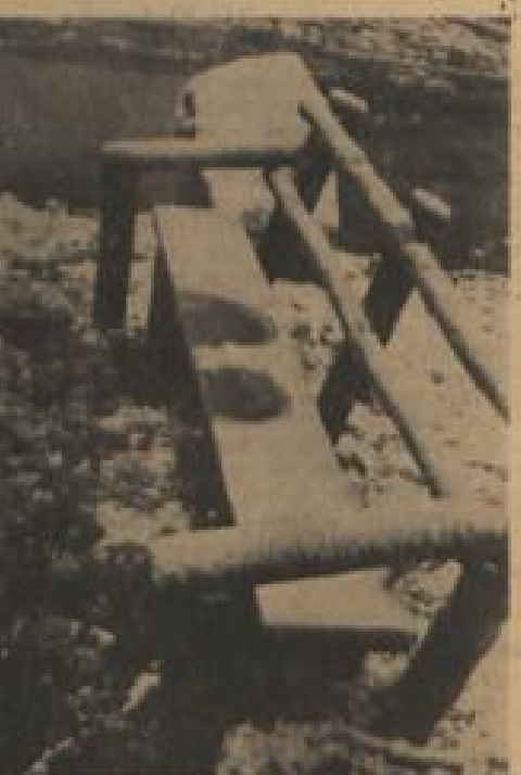
Hier waren's zwei — man sieht's auf einer Bank im Schnee. Nicht nur im Mai geht man zu zweit — Ich war es nicht — G.W.