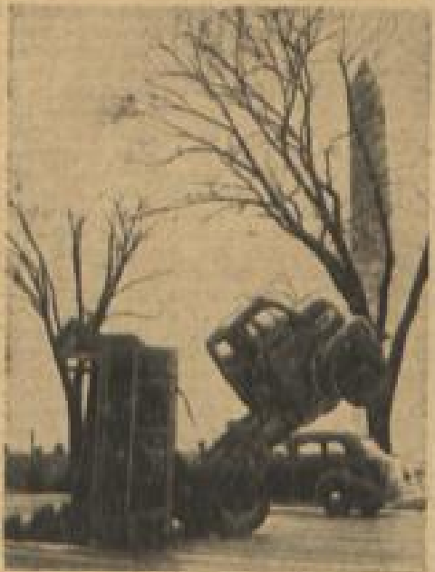
Um auf die Blume zu blicken... diesen kuriosen Unfall „benutzte“ ein Kraftfahrer auf einer Straße Washington. Zwischen Baumstamm und Chauffeur seines Wagens blieb noch so viel Platz, daß Personenkraftwagen ungehindert durchfahren konnten.