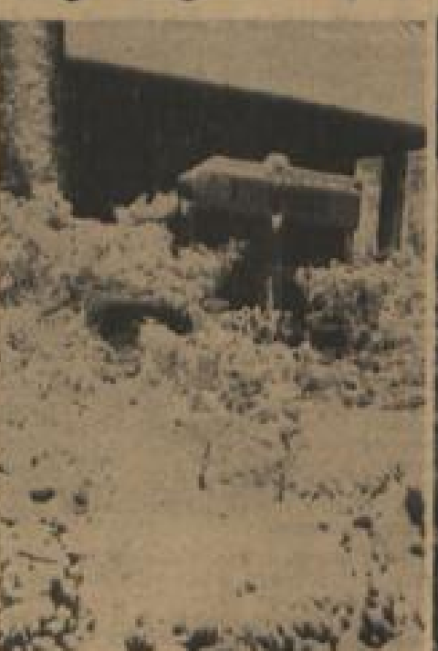
Ein Schild zeigt für den kühlen Mann die Richtung an. Wer ist geneigt und schließt sich diesem Wolkenstürmer an?