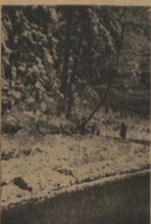
Der Winter kam — was können wir da machen! Und diese Kurve naher Er mit schier hundert „Sachen“.