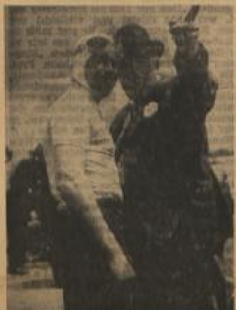
Caracciola und Neubauer. Ein unersetzliches Gespann auf allen Rennbahnen Europas, Afrikas und Amerikas. Der Rennleiter war nicht nur der große „Schichtenführer“, sondern auch der große Kamerad und seelische Director seiner Mercedes-Mannschaft.

Wetter-Frosch meint's Kalt in Niederrhein neblig-trüb Vorhersage bis Montag (18.11.) Bei schwacher Luftbewegung gelegentliche, häufig sogar nur örtliche Bewölkungsauflockerungen, sonst weiterhin vorwiegend stark bewölkt und in den Niederrhein teilweise düstern und neblig. Auch in der Ebene meist als Schnee niedergehen. Tagessumme: im Rheingebiet einige Grade über 0, nachts leichter, in Höhenlagen weiterhin mäßiger Frost. Auf rauen Strassen vorübergehend Glatteisbildung möglich. Übersicht: Bei den nur geringen Luftdruckgegensätzen über Mitteleuropa wird das Wetter in Süddeutschland weiterhin von der hier lagernden Kaltluft bestimmt. Wetteramt Karlsruhe Feiertag des Rheins am 11. November: Mainz 93 (4:5), Mannheim 96 (-2), Worms 96 (-1), Caub 47 (-2). Feiertag des Neckars am 14. November: Plochingen 104 (-2), Gundelsheim 105 (-3), Mannheim 95 (4:0).