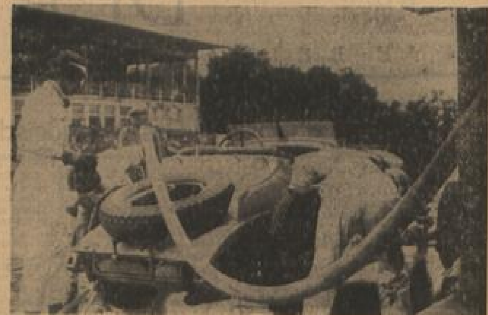
Das waren noch Zeiten, damals so um 1930 herum. Da fuhr man mit Schiebermütze, Schilde nach hinten... Der Beifahrer klebte sich die Reifen an und der Motor beriet ihn. Hier hält gerade „Caracciola“ an den Boxen und macht abseits keinen nervösen Eindruck. Schließlich jagte man sich damals noch nicht so wie ein paar Jahre später...

Zu dem Rennen waren insgesamt 91 Wagen gestartet. Nur 36 von ihnen (10 Sport- und 26 Tourenwagen) kamen ans Ziel. Sieger Karl Kling schlug nicht nur alle bisher aufgestellten Schnelligkeitsrekorde dieses Rennens, sondern