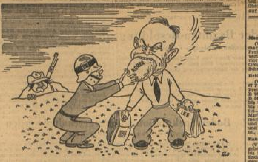
Eine harte Nuß für Eisenhower — und alle warten darauf, daß er sie knackt

Bad Homburg. (dpa) Etwa 80 Ritterkreuzträger aus allen Teilen der Bundesrepublik, denen nach ihren Angaben die Mitteilung der Abgabe des für den 22. bis 24. November vorgesehenen Treffens der „Gemeinschaft deutscher Ritterkreuzträger“ nicht rechtzeitig zugegangen war, trafen am Wochenende in Bad Homburg inoffiziell zusammen. Zahlreiche Teilnehmer übten dabei heftige Kritik an der jetzigen Organisationsform der Gemeinschaft zu ihren Zielen. Zum großen Teil wurde die Notwendigkeit einer besonderen Organisation für Ritterkreuzträger bestritten.